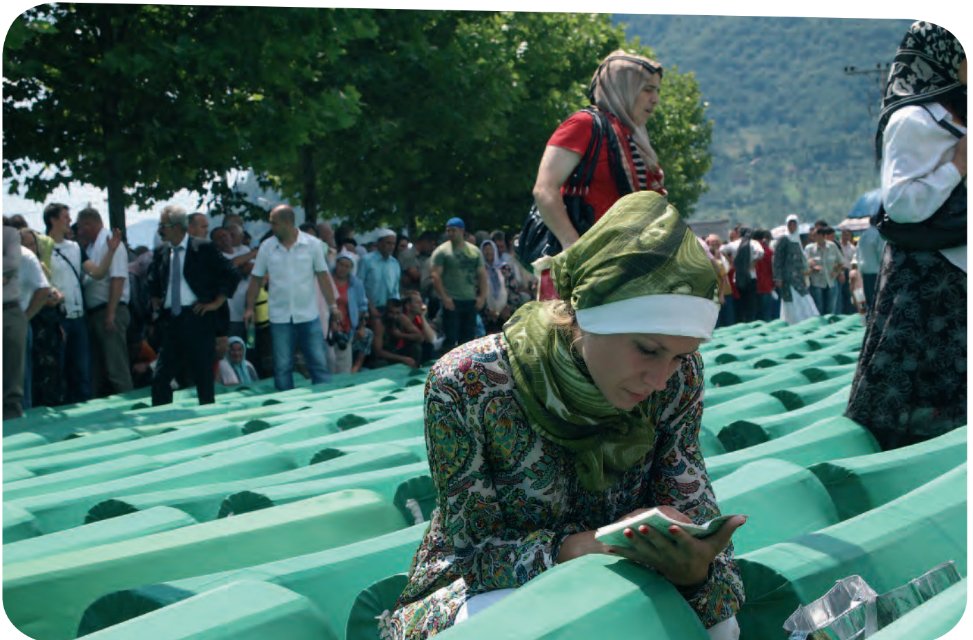
Op 11 juli worden de doden begraven △

na een paar maanden op. En dat terwijl door de aanhoudende oorlog de prijzen voor eten de pan uit rezen. Nuhanovic: “Een kilo suiker kostte in die tijd 50 euro, een ei was 5 euro. We zagen er begin 1993 uit als wandelende skeletten. De Serviërs kwamen bovendien steeds dichterbij. Op 17 april was er elke vijf seconden een bombardement. Srebrenica was die dag in 1993 bijna ingenomen.”