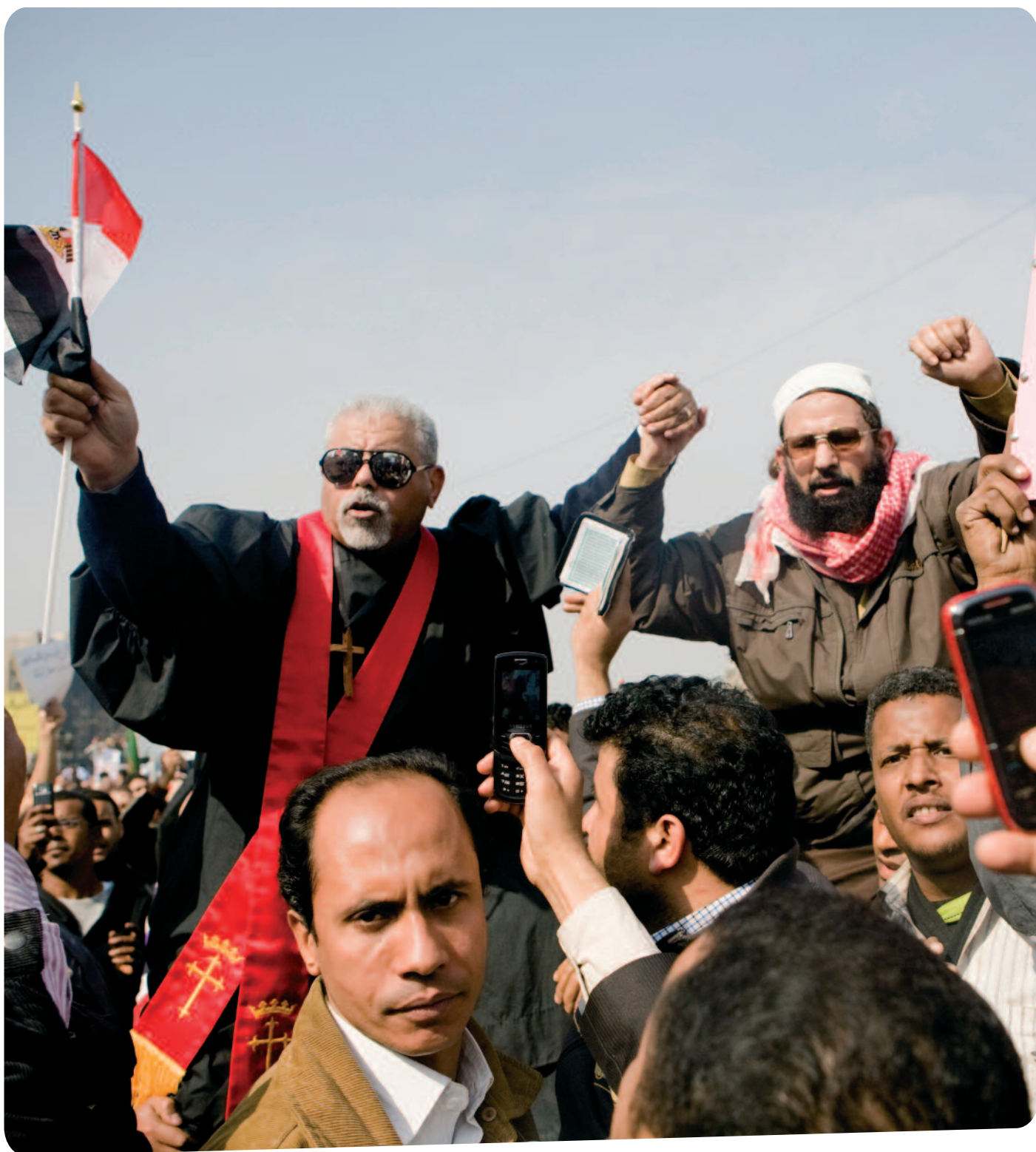
Kopten en moslims samen op het Tahrirplein in Cairo. △

de sharia voor vrijheid, gerechtigheid en waardigheid. En hoewel de christenen wel hun eigen kerkleiders mogen kiezen, heeft de geestelijkheid weinig ruimte om een bemiddelende rol te spelen in het huidige conflict in Syrië.” Al-Khatib is