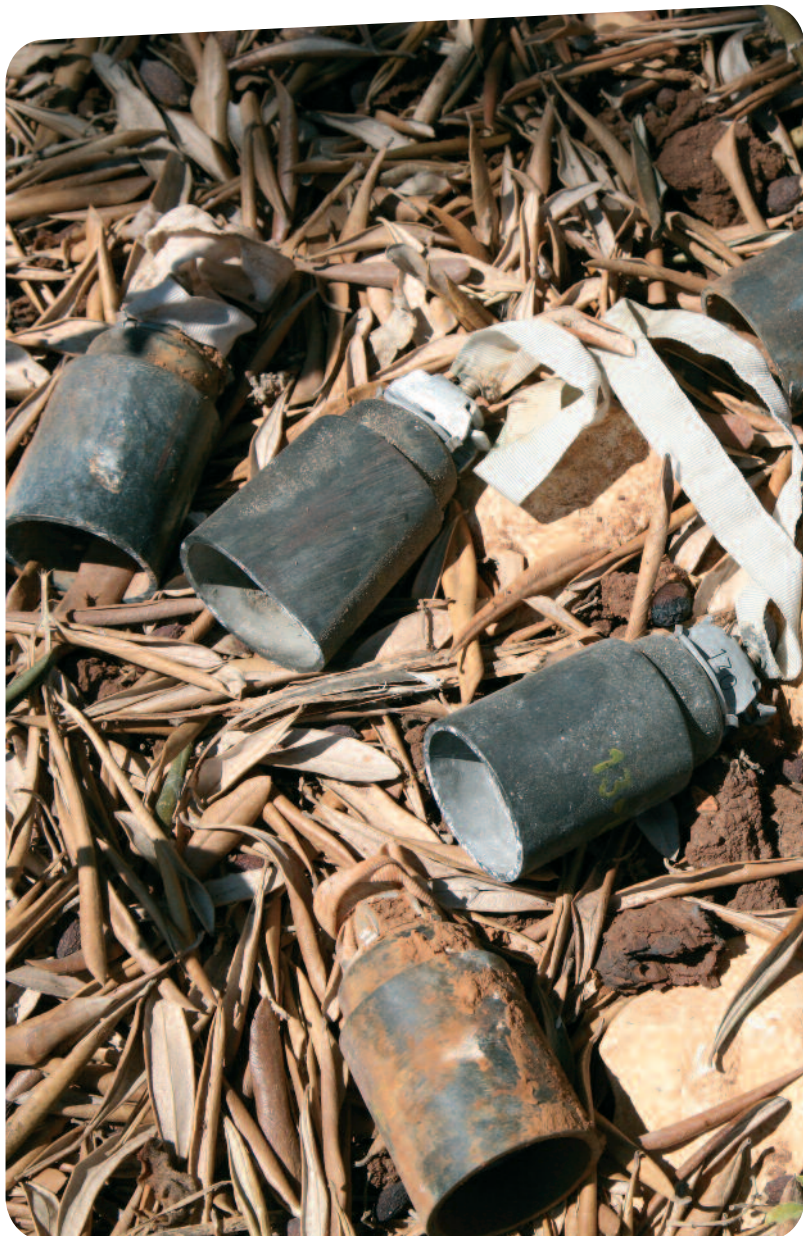
Foto voorkant: Tijdens de Pelgrimage naar Bethlehem.

▽ Clustermunitie blijft jarenlang liggen.