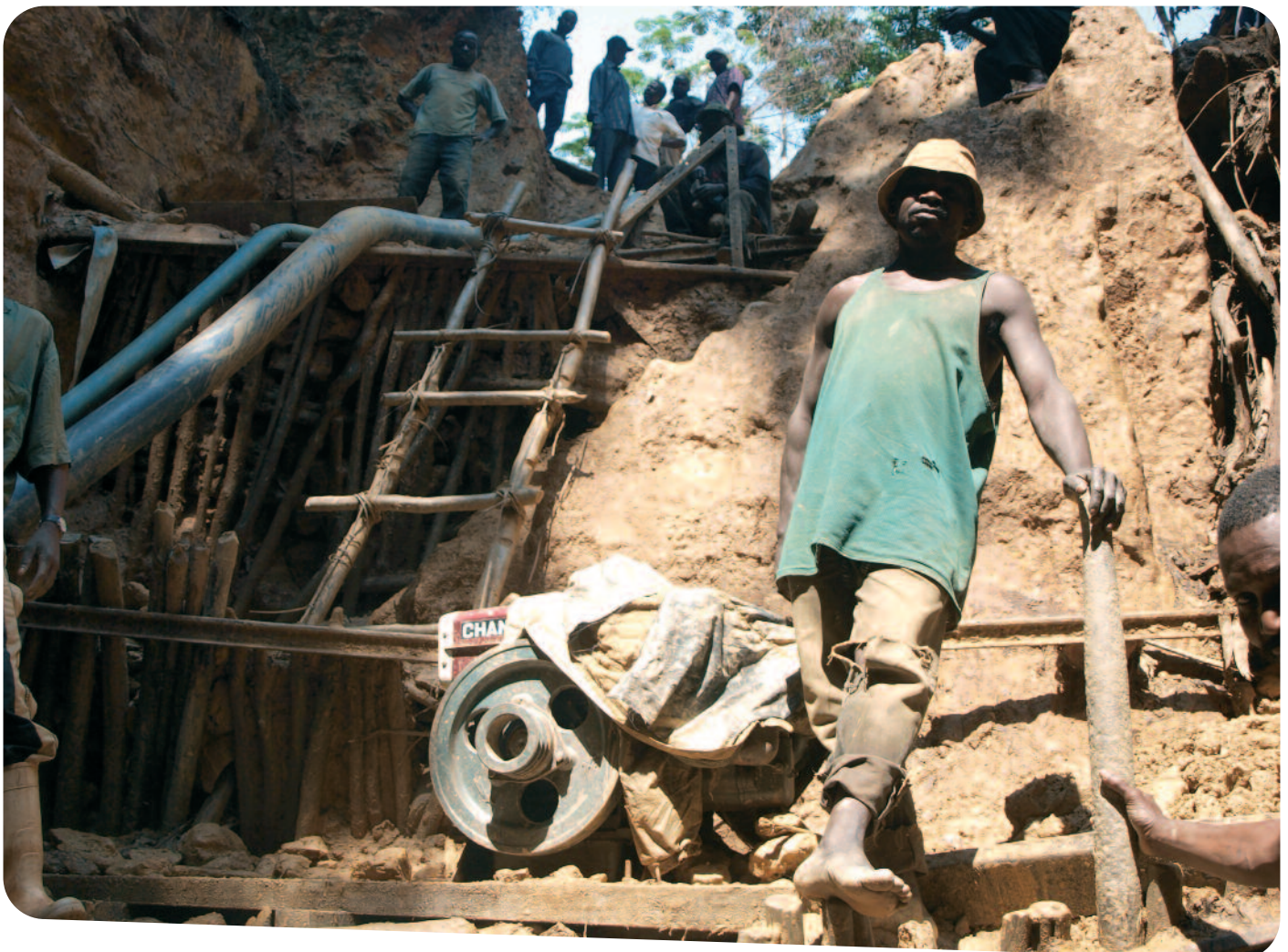
△ Kleinschalige mijnbouw in Oost-Congo.