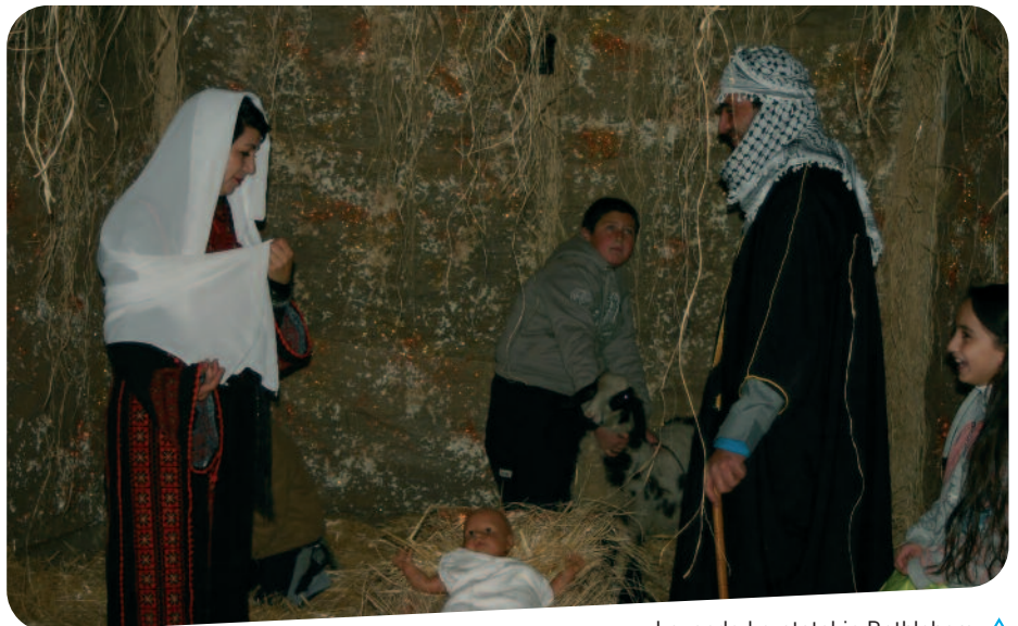
Levende kerststal in Bethlehem ▲

Als de mensenmassa na de Kerst uit de stad is weggetrokken, dient de realiteit voor de bewoners zich weer aan. De explosieve verhouding tussen Israël en de Palestijnen zorgt voor gevoelens van angst en frustratie over een ogenschijnlijk onoplosbaar conflict. Er vallen slachtoffers te betreuren aan beide zijden en wraak en agressie stapelen zich op. Veel inwoners van Bethlehem voelen zich verlaten en geïsoleerd door de bouw van een metershoge betonnen muur die inmiddels aan drie kanten van de stad is opgetrokken. In deze situatie kwam jaren geleden de oproep van de Palestijnse christenen uit Bethlehem om hen niet te vergeten. Zo ontstond bij