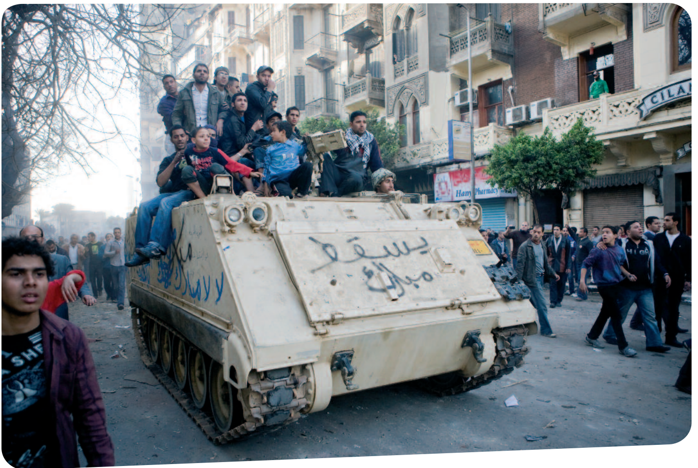
△ Demonstranten rukken op naar het gebouw van de geheime dienst.

Is er een nieuwe Arabische lente aangebroken? IKV Pax Christi volgt de ontwikkelingen die ingezet zijn met de Tunesische en Egyptische revoluties op de voet. Duidelijk is dat mensen geen onderdanen meer willen zijn, maar burgers met rechten. Zij verdienen onze steun.