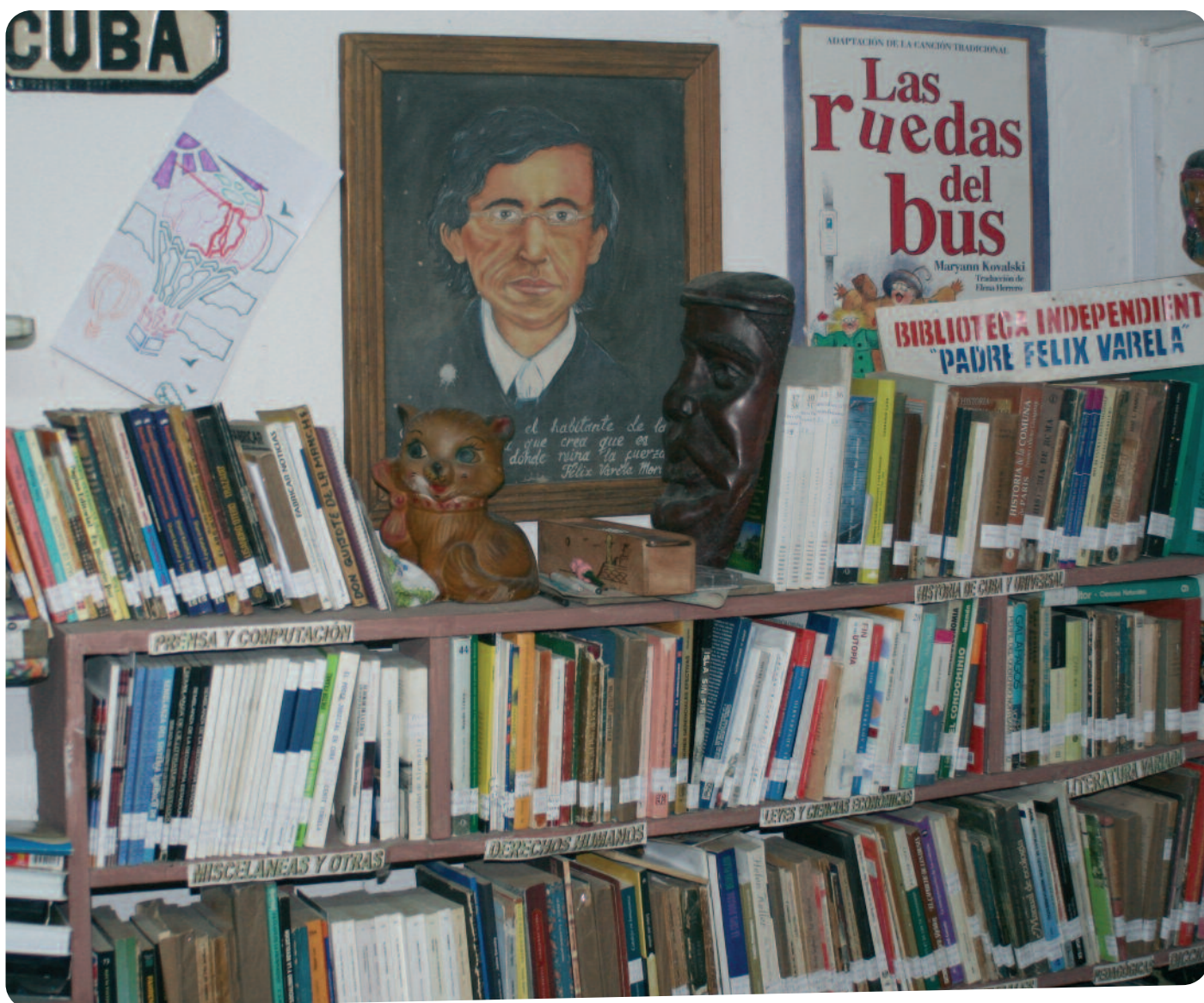
△ De meeste bibliotheken bevinden zich in een huis- of slaapkamer

lutionairen zijn. Toch hebben wij geen echt gevaar gelopen. Wij kunnen hooguit op het eerste vliegtuig het land uitgezet worden. Voor de Cubanen is het anders. Daarom is internationale aandacht voor hen zo belangrijk. Ze zijn blij dat er belangstelling is, dat ze hun verhaal kunnen vertellen en niet meer alleen op hun eiland zitten.”