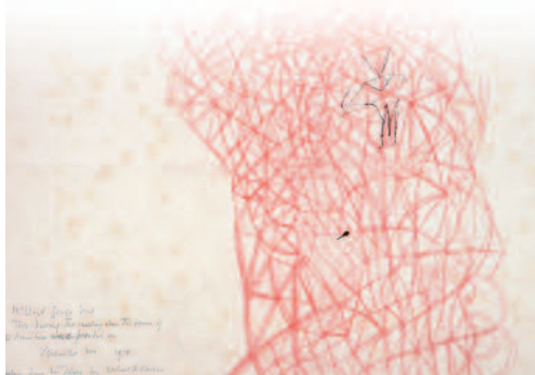
Over dilemma's rond vredesonderhandelingen