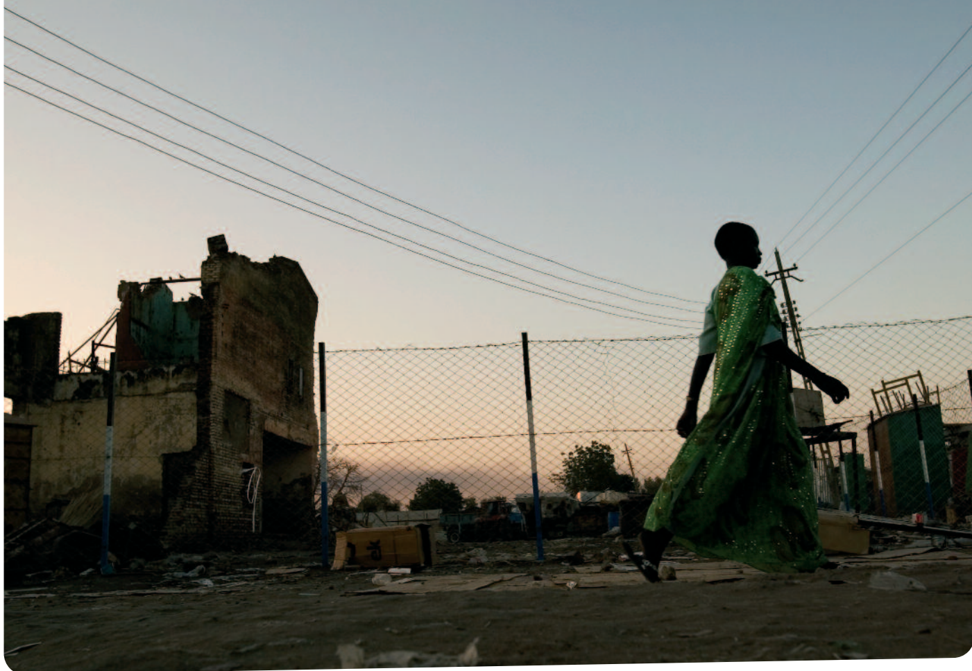
△ De sporen van de laatste oorlog zijn nog overal zichtbaar.