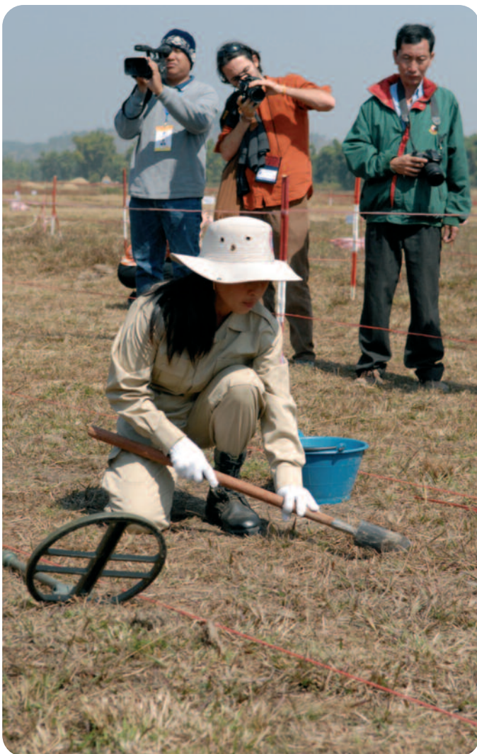
Demonstratie van ruiming van clustermunitie. ▲

Op de conferentie hebben we ervoor gepleit dat donorlanden meer fondsen beschikbaar maken voor ruiming en slachtofferhulp. Er moet expertise en apparatuur aangeleverd worden. De juridische verplichtingen die voortvloeien uit het clustermunitieverdrag verplichten ons hiertoe. Dit betekent dat er sneller werk gemaakt wordt van het opruimen van clustermunitie, zodat er niet weer veertig jaar overheen gaat.