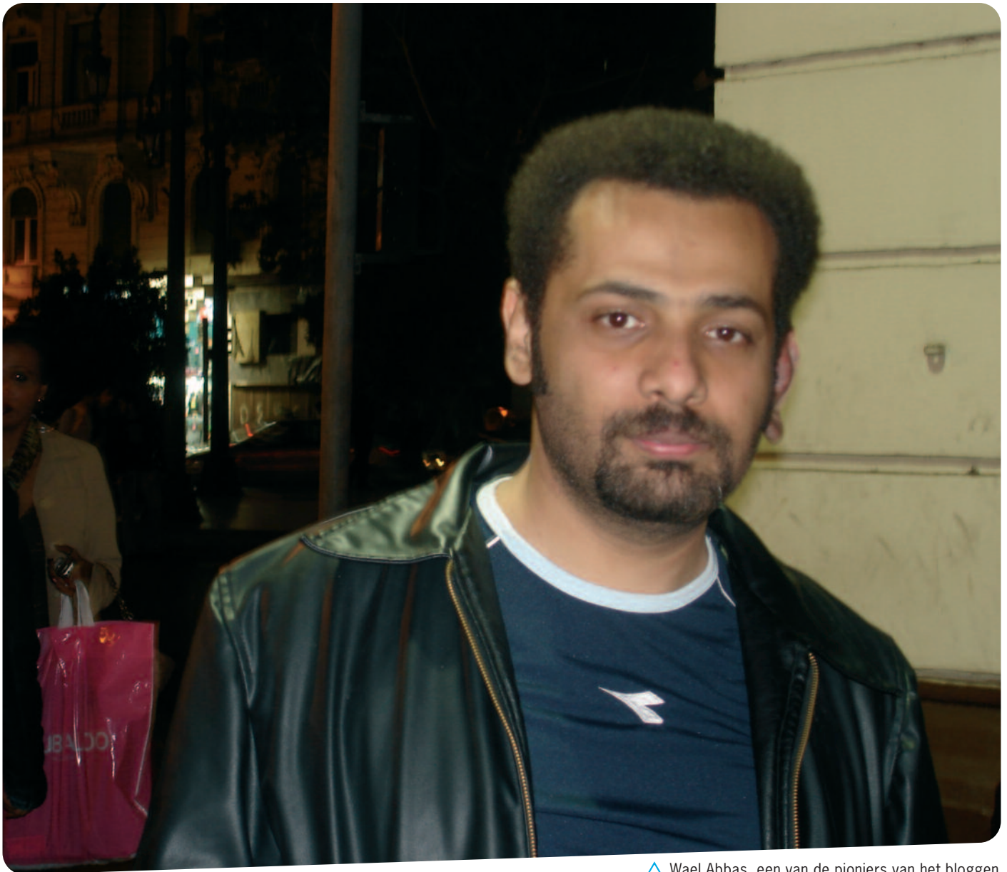
△ Wael Abbas, een van de pioniers van het bloggen

Wael Abbas (36 jaar) is een van de bekendste bloggers in het Midden-Oosten. Hij werd beroemd nadat hij in 2004 Youtube gebruikte om filmpjes van marteling en mishandeling door de politie online te zetten. Miljoenen mensen zagen en verspreidden de filmpjes. De Egyptische autoriteiten waren hierdoor gedwongen maatregelen te nemen tegen de daders. Tegelijkertijd probeerden ze Wael tot zwijgen te brengen. Abbas was een van de hoofdgasten op een door IKV Pax Christi georganiseerde Nacht van de Vrede.