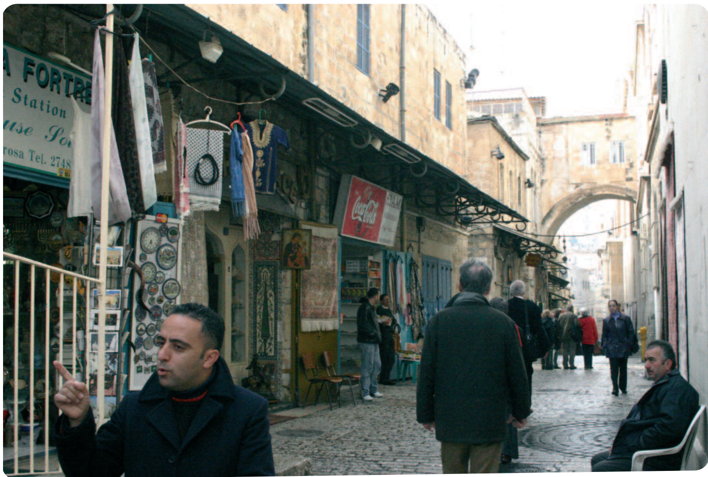
△ De pelgrims bezoeken naast Bethlehem ook andere steden.

Bethlehem is een ommuurde stad. De barrière tussen Israëli's en Palestijnen is in het landschap goed te zien en brengt veel Palestijnen in een isolement. Een keer in de twee jaar maakt IKV Pax Christi een pelgrimage naar Bethlehem en is daar tien dagen te gast bij Palestijnse families. Tijdens deze reis spreken de pelgrims met Israëliërs en Palestijnen van diverse pluimage. Dat varieert van Joodse rabbijnen tot Palestijnse vluchtelingen, Israëlische vredesorganisaties en Palestijnen die zich inzetten voor geweldloosheid.