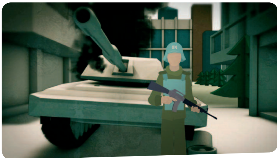
△ Een fragment uit de animatiefilm van IKV Pax Christi en ICBUW

“Er is al onderzoek uit laboratoria dat aantoonde dat er een relatie is tussen verarmd uranium en het ontstaan van tumoren, leukemie en geboortefwijkingen, maar onderzoek in getroffen gebieden is nog niet gedaan. Wij willen