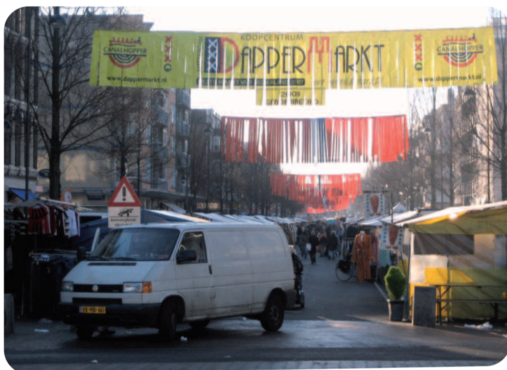
De Dappermarkt werd vorig jaar verkozen tot de beste markt van Nederland ▲

Op de Dappermarkt worden iedere morgen bij het begin van de markt door de marktmeester alle namen van de standhouders van die dag opgelezen. Iedereen kent elkaar daardoor bij naam, niemand is anoniem. Veel burens kennen elkaar niet en blijven dus vreemden voor elkaar. Het spreekwoord onbekend maakt onbemind, spreekt boekdelen. Als de onbekende dan ook nog anders is, kan dat een bron van angst vormen. Daarom is het zo belangrijk, ontmoeting tussen mensen met verschillende achtergrond te organiseren, in de buurt, op school, op het werk.