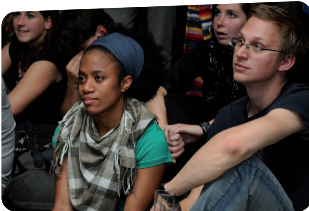
△ Jonge vredesvechters luisteren aandachtig