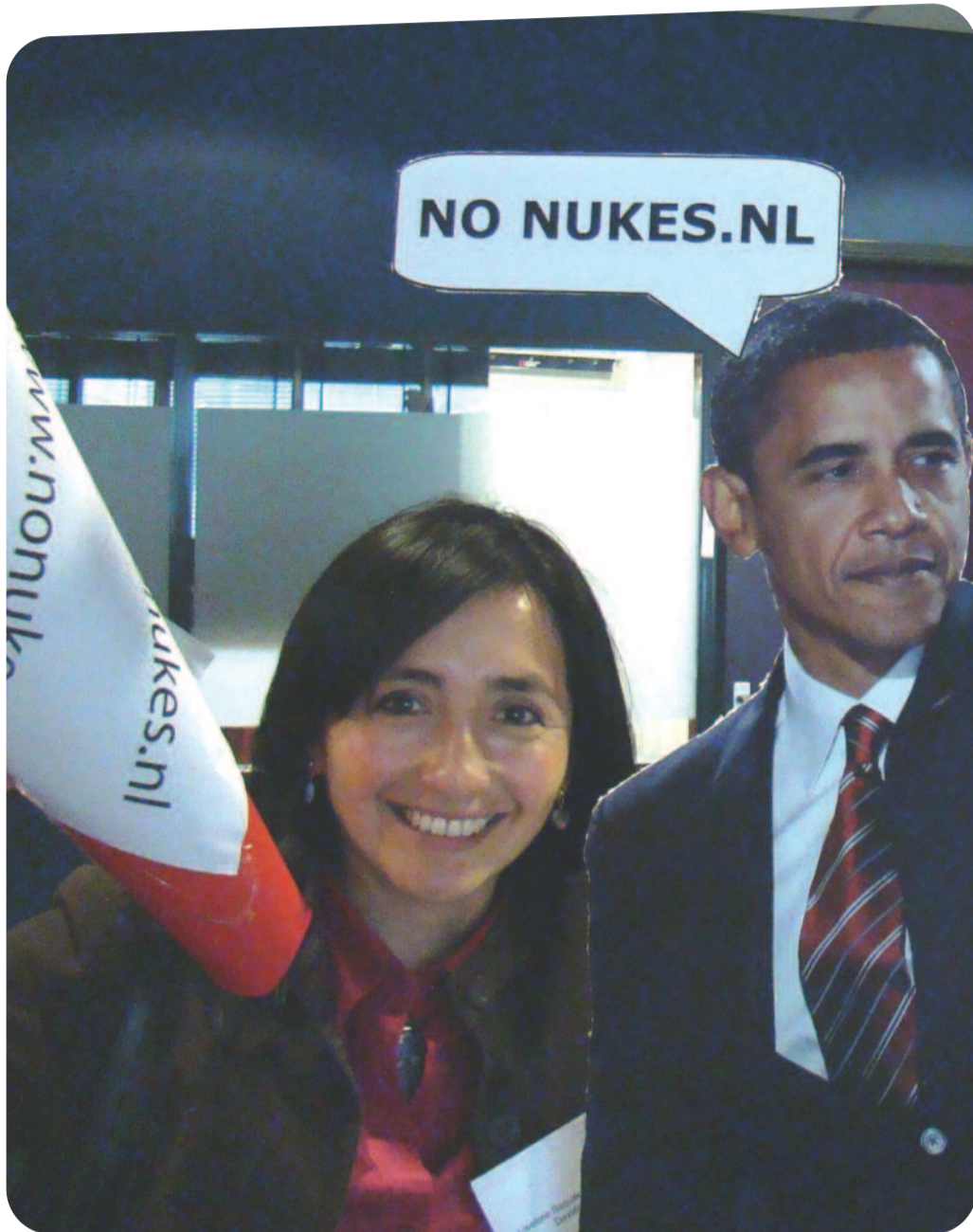
△ Obama inspireert ook op de Vredeswerkdag

“Das Morgenrot für eine bessere Zeit kommt aber nicht wie das Morgenrot nach einer durchschlafener Nacht.” Het morgenrood van een nieuwe betere tijd komt niet als het morgenrood van een nacht die men slapend heeft doorgebracht. Mooie, motiverende woorden die de Oost-Duitse zanger Wolf Biermann in 1976 uitsprak, kort voor hij de DDR (Oost-Duitsland) werd uitgezet.