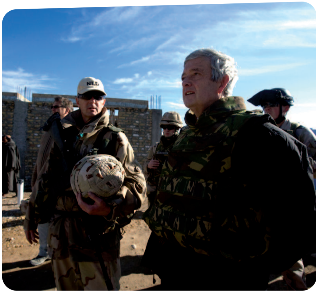
Minister op bezoek bij de troepen in Uruzgan. ▲

“Soms zijn militairen de enigen in een bepaald conflictgebied die iets aan opbouw kunnen doen”, vindt minister Eimert van Middelkoop, de eerste minister van Defensie afkomstig van de ChristenUnie. In deze Vredeskrant geeft hij zijn visie op ‘een nieuw klimaat van vrede’.