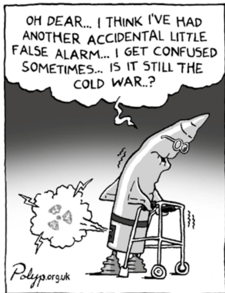
Verouderde kernwapens kunnen voor ongelukken zorgen.

Meld je aan voor de email nieuwsbrief of abonneer je gratis op het PAX Magazine. Volg ons op Facebook en Twitter, zo mis je nooit iets. Ga naar www.paxvoorvrede.nl en meld je aan.