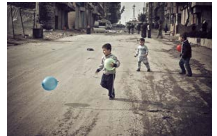
Kinderen in Syrië spelen nauwelijks nog op straat.

In de Vredesweek van vorig jaar vroeg PAX aandacht voor vredesactivisten in Syrië . Die aandacht hebben ze nog steeds nodig, want de oorlog in Syrië duurt voort.