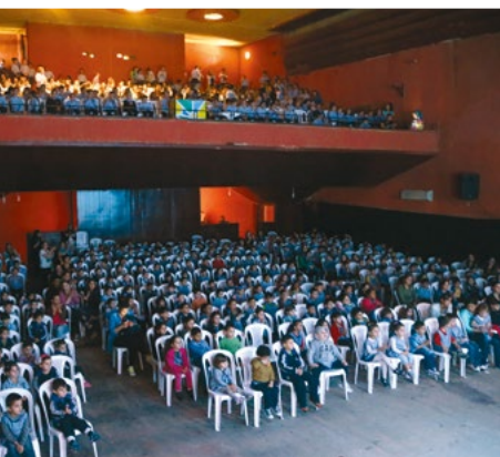
Kinderen in het Al Hamra theater in Tyrus.