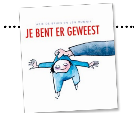
Gedichten met cartoons over de situatie van kinderen in Palestina en Israël

We werden verondersteld geen werk te doen. Er werd al op zaterdag een grote pan soep gekookt, zodat ook moeder op zondag niet hoefde te werken. Met de Israëlisch - Arabische oorlogen van '67 en '73 en de periode daarna kwam voor mijn gevoel de