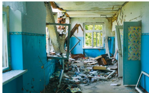
Regionaal psychiatrisch ziekenhuis buiten Semenivka, vlakbij Sloviansk.

De foto's van Dirk-Jan Visser zijn vanaf januari 2016 te bewonderen in het Humanity House in Den Haag.