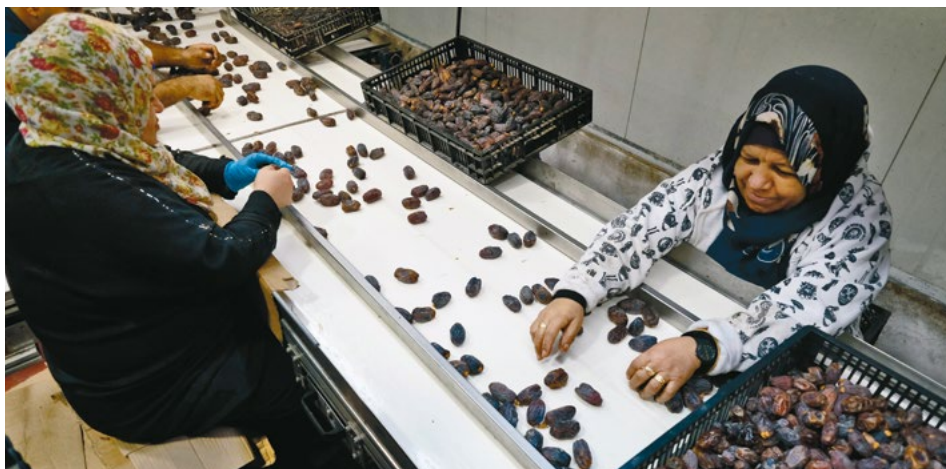
Palestijnse werknemers in een Israëlische dadelfabriekje op de Westelijke Jordaanoever.

politiek en daarmee een totaal ander Israël in ons leven. Fel waren de gevoelens in de familiekring voor het zo bedreigde Israël, dit land dat volgens het Verbond aan het Joodse volk behoorde. Dit wonder, deze vervulde belofte, dit volk dat de ‘woestijn deed bloeien’. En nu voelt het juist ook als een verantwoordelijkheid om samen met Israëlische vredesactivisten de extreme en ondemocratische tendensen in de Israëlische politiek proberen te keren. Juist in het belang van de vrede. Of dat durf vergt? Tja, Israël moet een gewoon land worden en zijn politiek iken aan het internationale recht. Het moet handelen naar de wet.” ♦