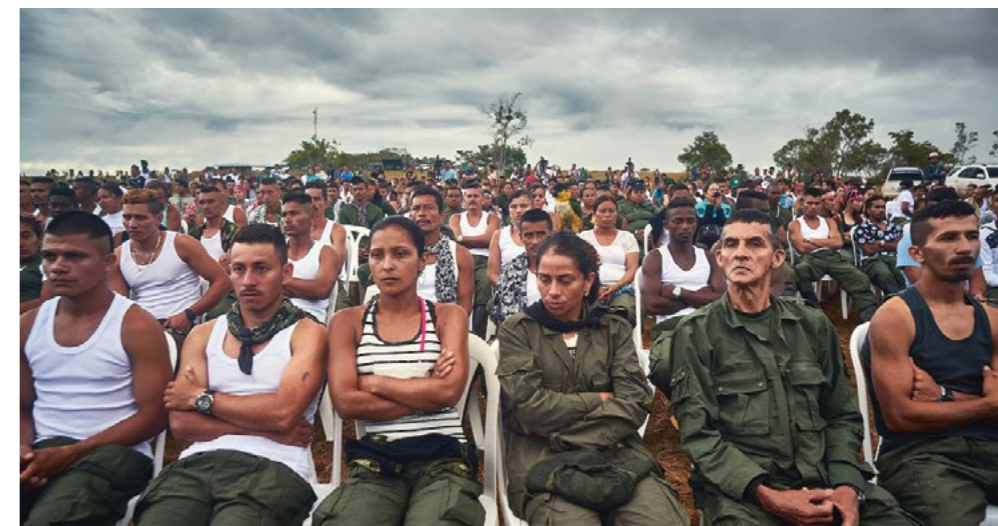
FARC bijeenkomst in september in Meta.

Vier jaar lang heeft PAX hier, in overleg met het ministerie van Justitie, honderden conflictbemiddelaars opgeleid, afkomstig uit de gemeenschappen zelf. Een conflict over een ongewenste zwangerschap, een erfenis, een