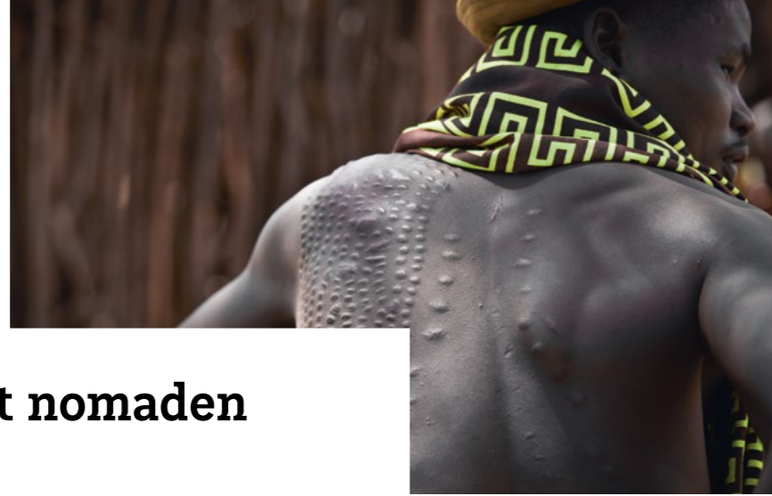
Ijttekens op de rug van een strijder geven aan hoeveel vijanden hij gedood heeft.

Tien jaar werken met nomaden in het grensgebied