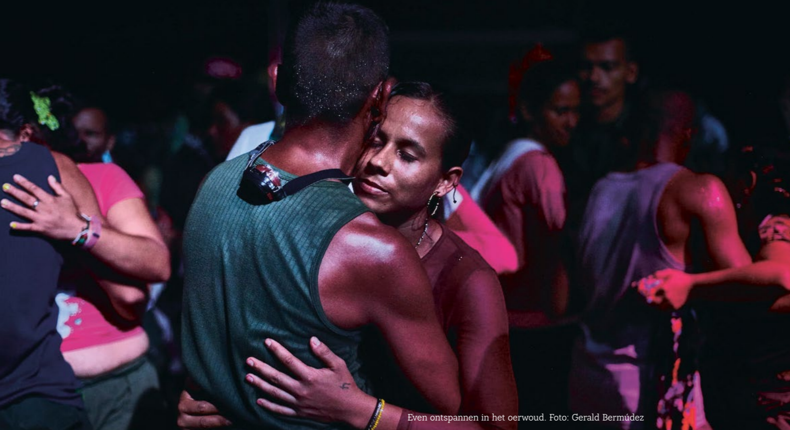
Even ontspannen in het oerwoud.