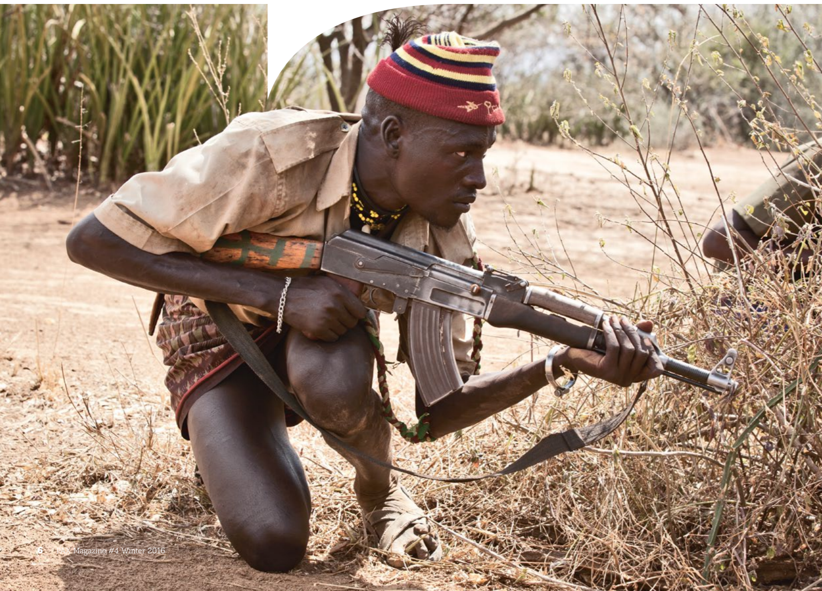
Krijger met Kalasjnikov.

Na tien jaar werken met nomaden in het grensgebied van Zuid-Soedan, Oeganda en Kenia, is het tijd voor een terugblik. Het geweld lijkt door het vredeswerk van PAX en partnerorganisaties afgenomen. Het door PAX opgezette vredesnetwerk werpt zijn vruchten af.