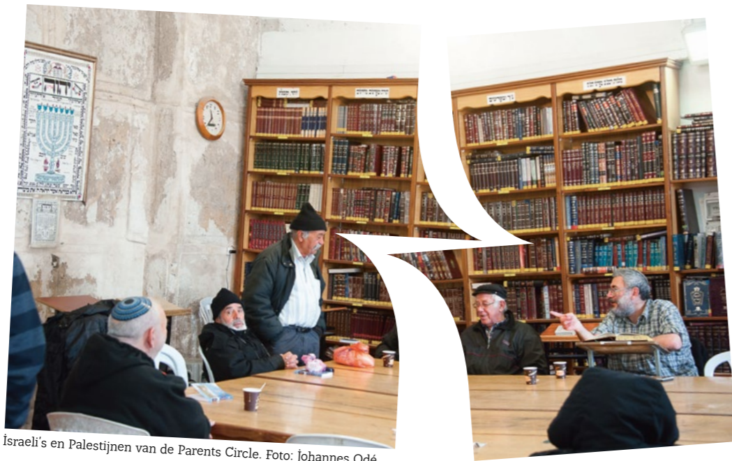
Israëli's en Palestijnen van de Parents Circle.