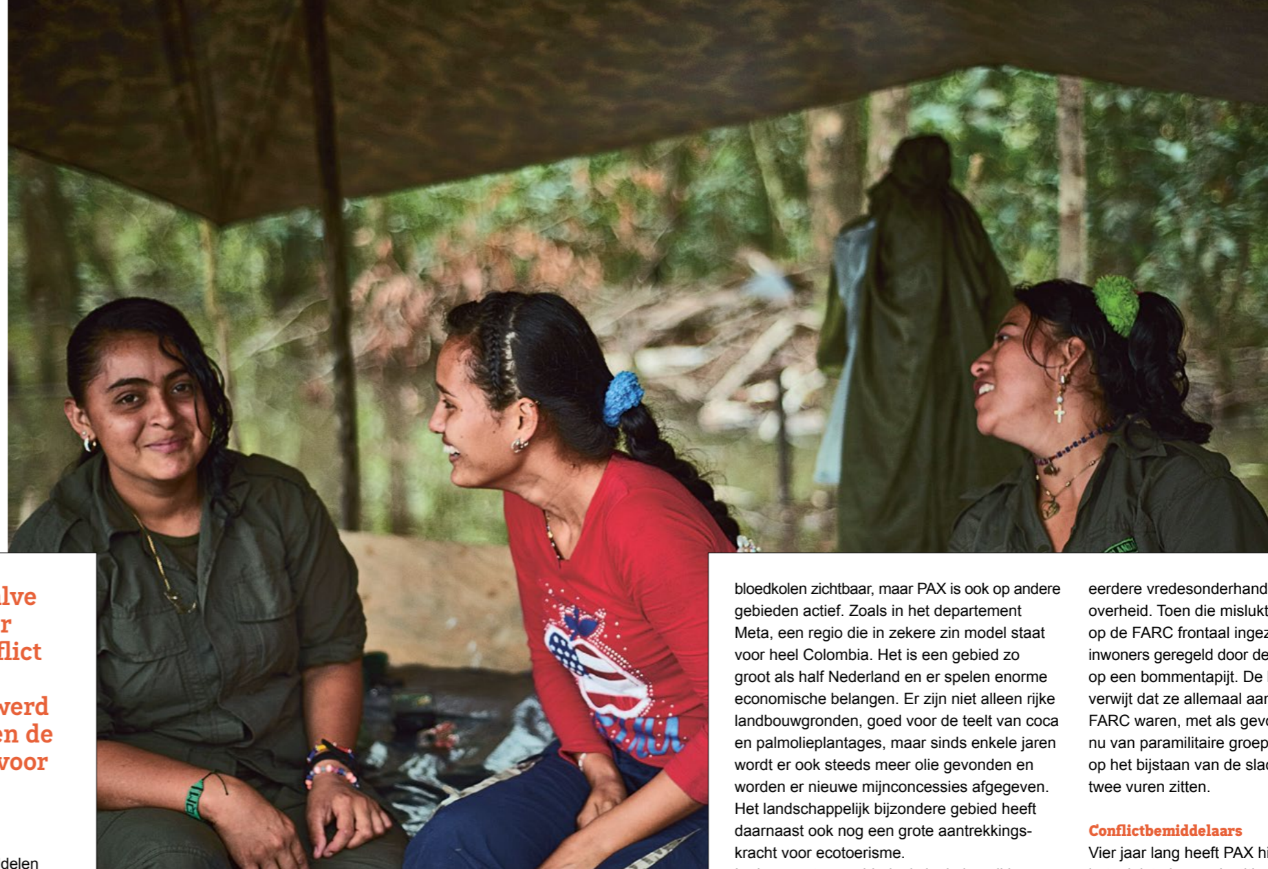
FARC Strijders in het oerwoud wachten op in werking treding van het vredesakkoord.

PAX is al veel jaren actief voor vrede in Colombia. Daarin is vooral de campagne tegen