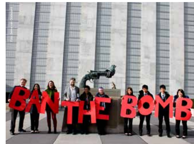
Campaigners van over de hele wereld aanwezig bij de VN-onderhandelingen over het kernwapenverbod in New York

PAX voert de strijd samen met de slachtoffers uit Soedan en Zuid-Soedan. In de tijd waarin Lundin enorme winst maakte in de oorlogsregio, verloren de inwoners hun geliefden, land, vee, oogst, scholen en bezittingen en waren zij slachtoffer van grove mensenrechtenschendingen.