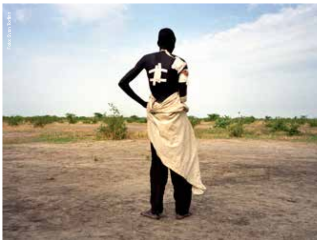
Gewonde man bij Rier in Zuid-Soedan, mei 2002