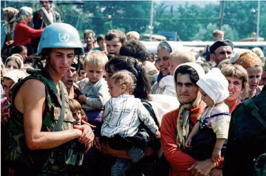
Afbeelding 14: Bosnische moslimvluchtelingen wachten op vervoer uit Srebrenica, nadat de stad door de Bosnische Serviërs is ingenomen (foto uit 1995) 164

Zo is afbeelding 14 opgenomen in een paragraaf over 'Nederland en de wereldpolitiek', waarin wordt gesteld dat een Nederlands bataljon in Srebrenica vluchtelingen moest beschermen. 'De stad was omsingeld door vijandelijke troepen... De vijandelijke legers gingen tot de aanval over en ongeveer 8.000 vluchtelingen werden vermoord. De Nederlandse VN-militairen konden door hun te lichte bewapening en gebrek aan hulp geen weerstand bieden'. 164 Leerlingen zien vrouwen en kinderen, een enkele man en slechts één VN-militair, die niet als Nederlander herkenbaar is. Deze afbeelding verkleint de empathische afstand ten aanzien van het drama en kan daardoor het slachtofferschap van de vluchtelingen en tevens de onmacht van de VN-soldaten versterken.