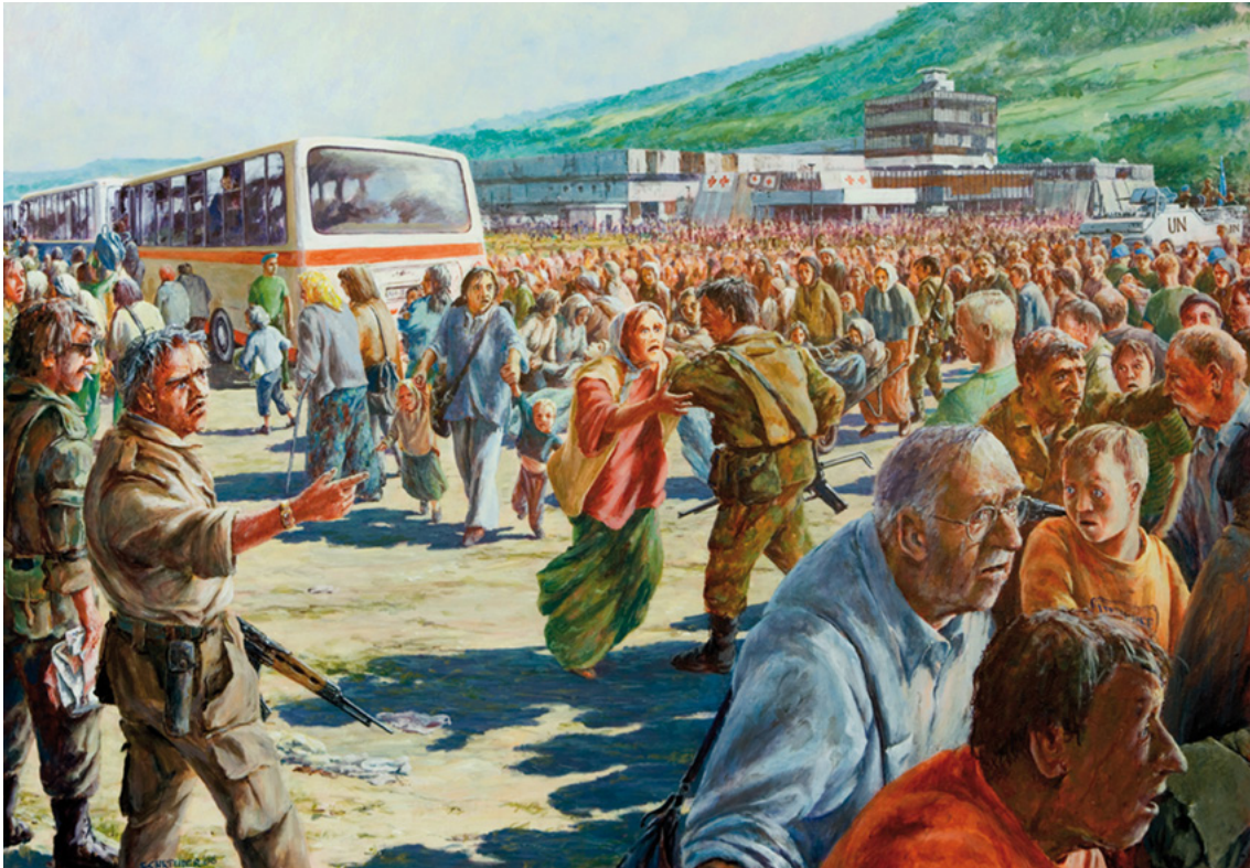
Afbeelding 13. Schoolplaat behorende bij het canonvenster over Srebrenica.

gediend, voorzeker - maar de commissie wil docenten en andere werkers met de canon uitdrukkelijk op hiermee verbonden risico's attenderen. 134