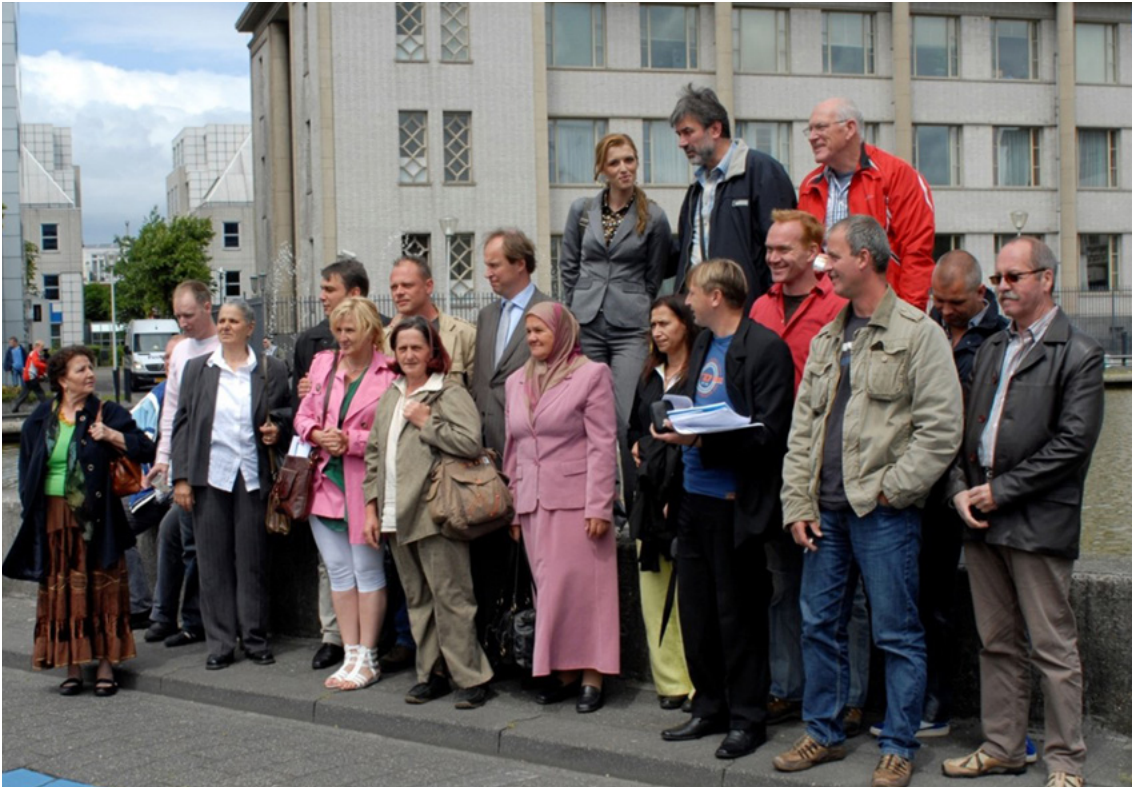
Afbeelding 11: PAX organiseerde in juni 2009 voor overlevenden en Dutchbatters een gezamenlijk bezoek aan het ICTY in Den Haag.

verantwoordelijk worden gehouden “voor de acties van hun soldaten tijdens vredesmissies”. 68 Ook vredesorganisatie PAX benoemde het baanbrekende juridische oordeel, en wees erop dat de eerdere stellingnames van Kok, Balkenende en andere politici met deze twee uitspraken van de Hoge Raad in feite onhoudbaar zijn geworden.