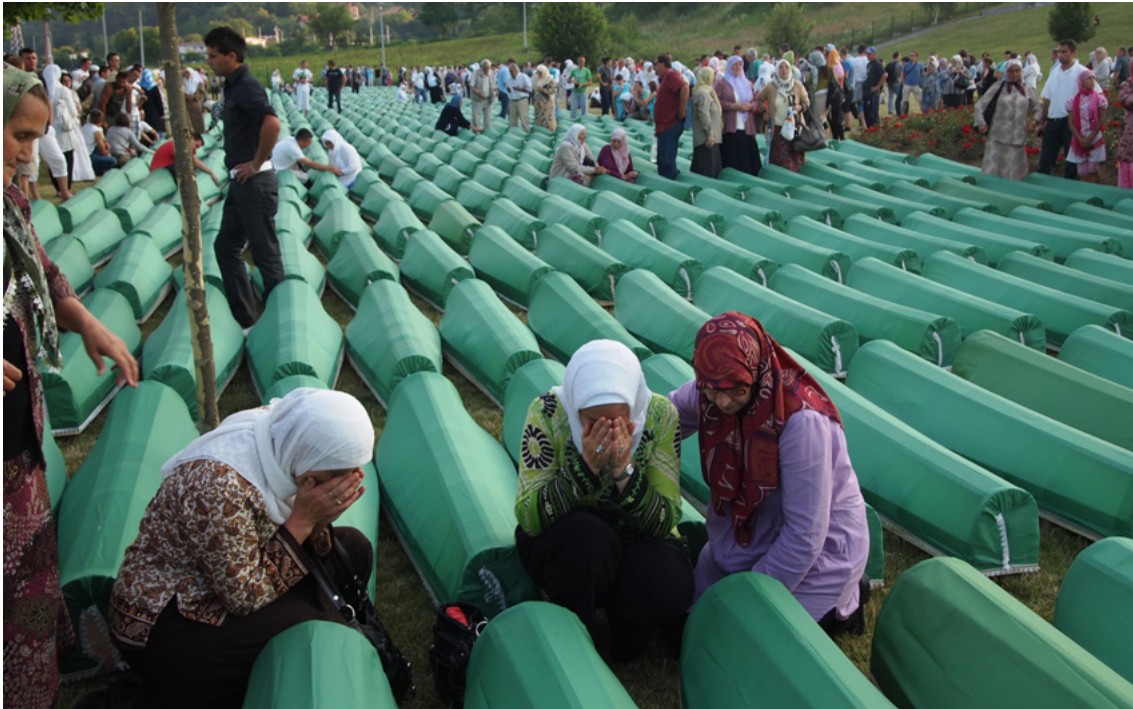
Afbeelding 9: Jaarlijks worden op 11 juli op een speciale begraafplaats in Potočari de stoffelijke overschotten begraven die in de twaalf maanden daarvoor geïdentificeerd zijn.

De (late) toekenning door de Nederlandse regering (in 2006) van een zogenaamd 'draaginsigne' aan de voormalige Dutchbat-militairen (uit 'erkenning voor hun gedrag in moeilijke omstandigheden') leverde echter weer veel kritiek op. Ook bij deze gelegenheid werd van rijkswege gewezen op het beperkte mandaat en de slecht uitgeruste aard van de missie. Overlevenden en familieleden van de slachtoffers veroordeelden de toekenning en noemden het een 'vernederende beslissing'. Protestbijeenkomsten vonden plaats in Den Haag, Assen (waar de ceremonie plaatsvond) en in Sarajevo. De Nederlandse ambassadeur werd door de Bosnische regering op het matje geroepen. 57 Ook buitenlandse kranten wijdden er kritische kolommen aan.