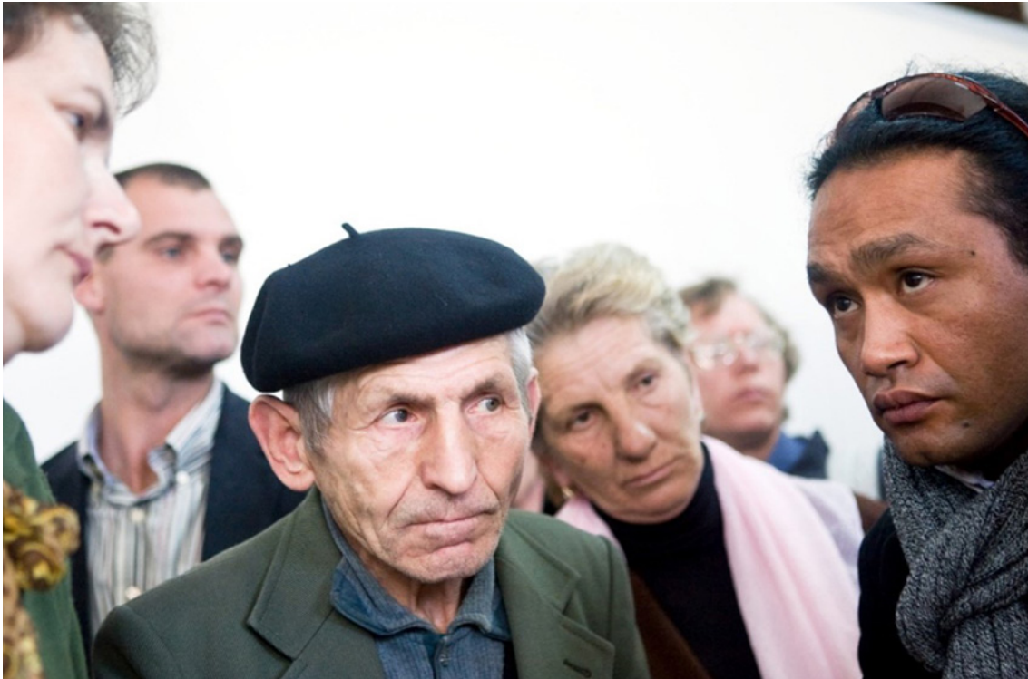
Afbeelding 1: PAX organiseerde meerdere gesprekken tussen Dutchbatters en overlevenden. Ontmoeting in 2007, in Srebrenica.