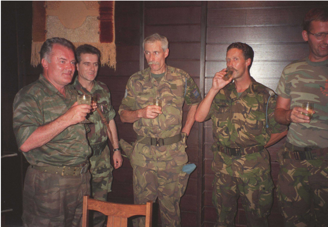
Afbeelding 7: Ontmoeting van Dutchbatcommandant Karremans met Bosnisch-Servische generaal Mladić, in Bratunac, 11 juli 1995.

middag van 13 juli waren alle Bosniakken die niet op de compound waren toegelaten afgevoerd. De militaire leiding van Dutchbat besloot daarop tot het wegsturen van de Bosniakken uit de relatief veilige compound. Ze werden door Dutchbat uitgeleverd aan de Bosnische Serviërs, waarop zij werden gesepareerd en afgevoerd. Alle mannen en jongens werden geëxecuteerd. In 2019 vonniste de Hoge Raad – voor een deel in navolging van het gerechtshof van Den Haag in 2017 - dat de Nederlandse Staat gedeeltelijk aansprakelijk was voor de gewelddadige dood van 350 moslimmannen die bescherming hadden gezocht in de VN-compound. Volgens het hof hadden Dutchbat-militairen ‘onrechtmatig’ gehandeld door mee te werken aan deze deportatie en had de leiding van Dutchbat geweten moeten hebben dat de 350 mannen “een reële kans hadden op een onmenselijke behandeling of executie”. 40 Vrouwen en kinderen werden geëvacueerd naar veilige, door de Bosnische troepen gecontroleerde gebieden tientallen kilometers verwijderd van Srebrenica. Sommige Dutchbat-militairen waren getuigen van executies van Bosniak mannen door Servische militairen. Vrouwen en meisjes werden op weg naar voor hen veilig gebied veelvuldig lastig gevallen en tientallen werden uit de bussen gehaald en door Bosnische Serviërs verkracht en/of op andere wijzen seksueel misbruikt. 41