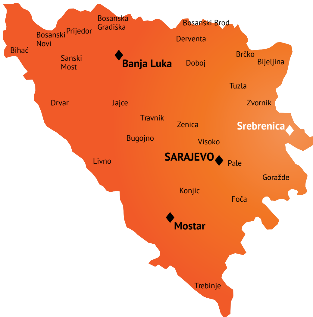
Afbeelding 3: kaart van Bosnië-Herzegovina, 1992