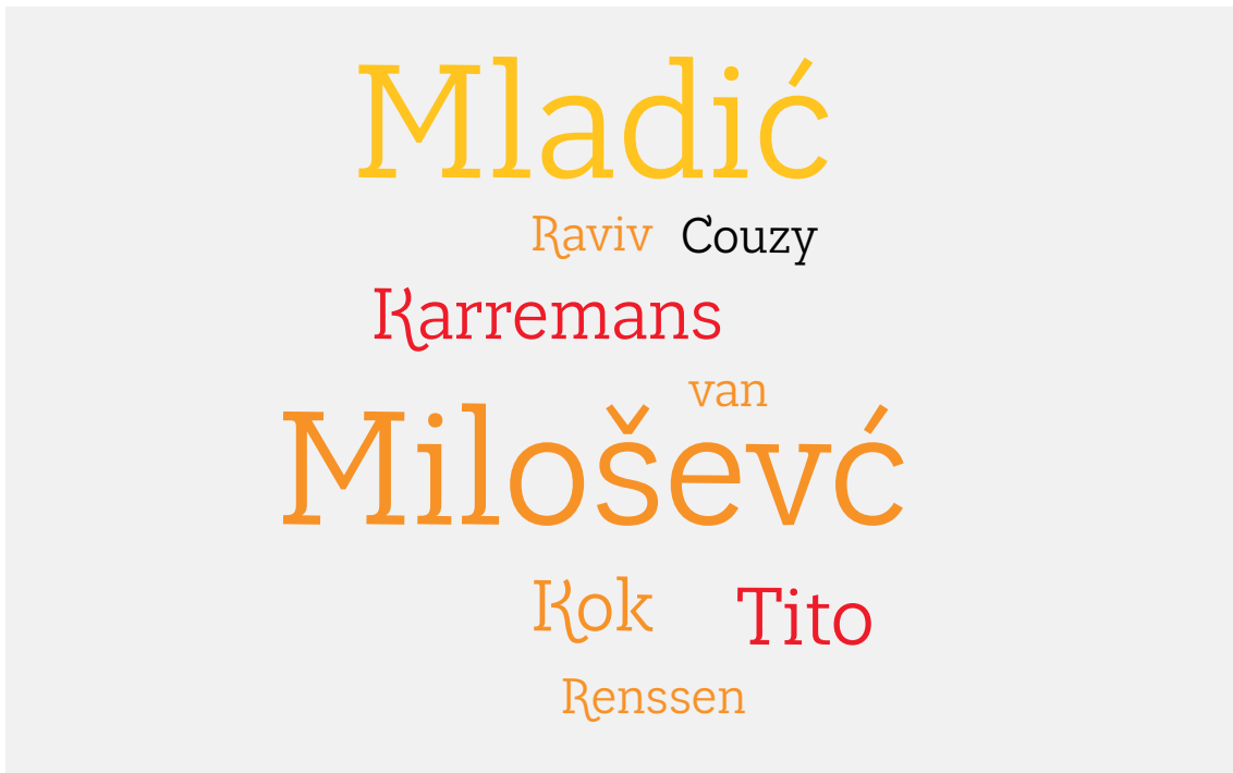
Afbeelding 12: meest voorkomende namen in leermiddelen voor het voortgezet onderwijs

In andere leermiddelen worden de Dutchbatsoldaten hier en daar (vaak impliciet) bekritiseerd. Zoals we hebben gezien beschouwt het merendeel van de methoden Dutchbatters als slachtoffer van een falende internationale gemeenschap en Nederlandse overheid. Maar in Sprekend Verleden (2019) wordt gesteld dat 'volgens een vonnis van de rechtbank van Den Haag uit 2017 ... de Dutchbat-militairen 'onrechtmatig' mee[werkten] aan de evacuatie van 350 moslimmannen uit de relatief veilige VN-compound. Nadat Dutchbat hen had uitgeleverd aan de Bosnische Serviërs werden zij geëxecuteerd. 116 En in Geschiedeniswerkplaats (2014):