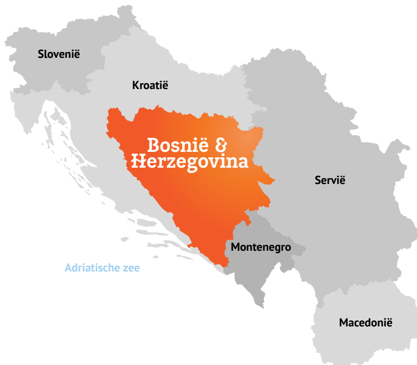
Afbeelding 2: Joegoslavië, vóór de oorlog

na afloop van dergelijke conflicten, hoewel een en ander soms wordt overschaduwd door een (actief) herinneringsbeleid dat het betwiste verleden vertroebelt of neutraliseert. 5