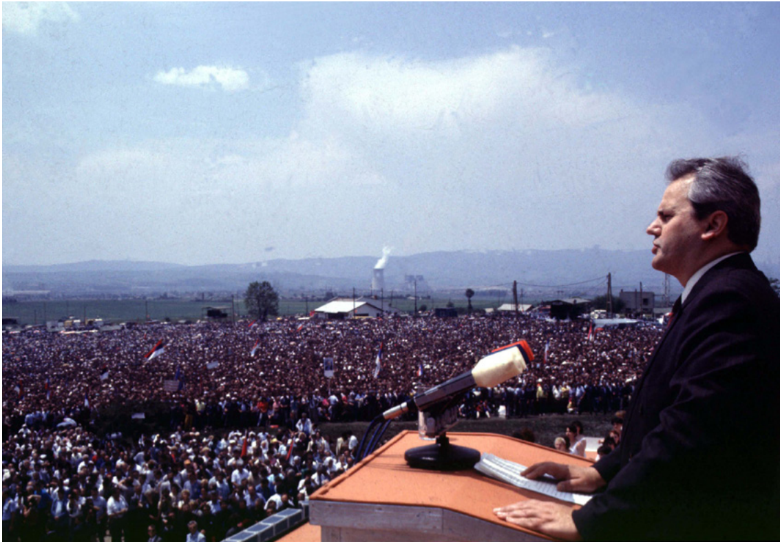
Afbeelding 4: Milošević op het Merelveld, in Kosovo, in 1989.

Het boegbeeld van het nationalisme onder de Serviërs werd Slobodan Milošević, de communistische partijleider in Belgrado. Hoewel hij aanvankelijk een tegenstander was van het Servisch nationalisme, werd hij na een bezoek aan Kosovo in 1987 geraakt door het vuur van de Servische natie: 'hij ging als een communist naar Kosovo Polje, en kwam terug als een Serviër'. 18 Met name de beslissing om de autonomie van Vojvodina en Kosovo grotendeels teniet te doen ten faveure van toenemende Servische invloed (1988) en de toespraak van Milošević op de herdenkingsbijeenkomst van de Slag op het Merelveld (1989) wakkerden de onrust en verdeeldheid in Joegoslavië verder aan. 19 Vooral Slovenië en Kroatië voelden zich bedreigd in hun autonomie door de toenemende macht van Servië (dat steun kreeg van Montenegro). 20