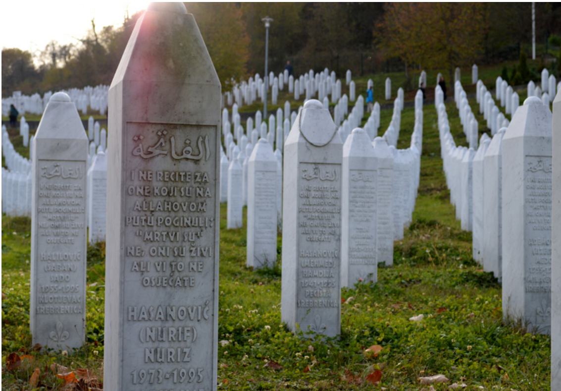
Afbeelding 15: De begraafplaats voor de slachtoffers van de genocide in Potočari. Er liggen inmiddels 6.643 slachtoffers begraven.