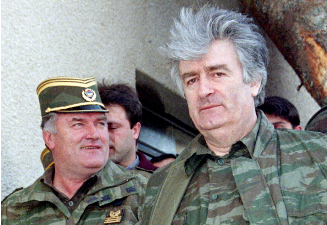
Afbeelding 5: Ratko Mladić en Radovan Karadžić, tijdens de oorlog.

Al vroeg tijdens de Bosnische Oorlog werd er heftig gevochten in de heuvels rondom Srebrenica. Het overwegend door Bosniakken bewoonde gebied van Centraal Podrinje (de regio rond Srebrenica) was van strategisch belang voor de Serviërs, omdat anders geen territoriale eenheid zou kunnen worden gerealiseerd ten behoeve van de nieuwe Servische politieke entiteit Republika Srpska . 27 Daarom werden de Bosniakken met geweld verdreven uit hun woongebieden in Oost-Bosnië, hun huizen en moskeeën verwoest en meer dan 3.100 burgers vermoord. Het Bosnische Instituut in Londen heeft een lijst gepubliceerd van 296 dorpen en dorpjes rond Srebrenica die door Servische troepen zijn verwoest tijdens de eerste drie maanden van oorlog (april - juni 1992). Meer dan drie jaar vóór de genocide van Srebrenica verdreven Bosnisch-Servische nationalistenvan met steun van Servië en het Joegoslavische Volksleger (JNA) - ongeveer 70.000 Bosniërs uit hun huizen. 28