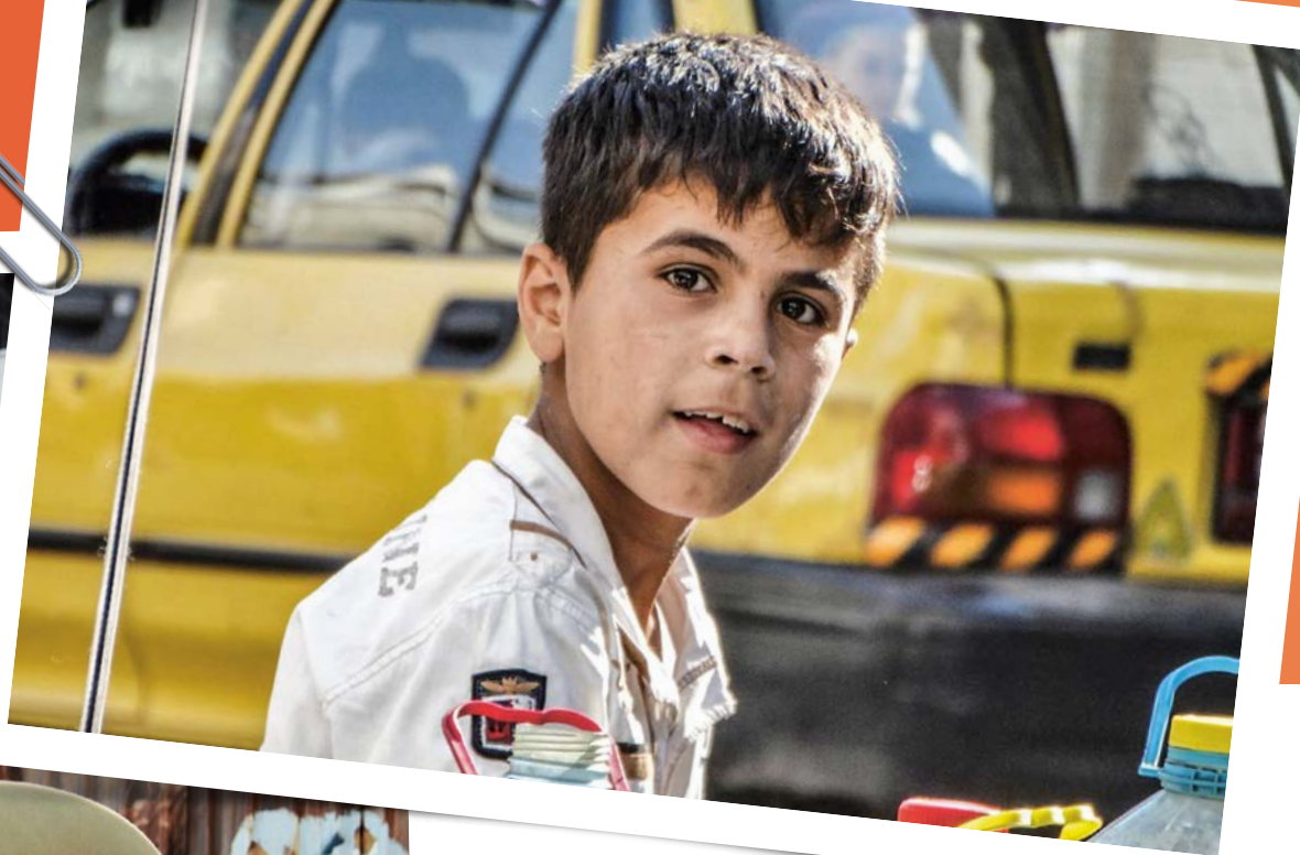
Foto's boven: Ontheemde kinderen die elders een nieuw leven opbouwen Foto's onder en links: Jongens worden aangetrokken door milities