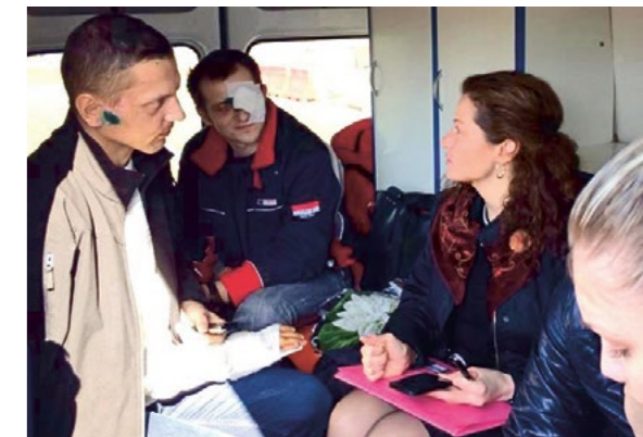
Strijders werden voor verzorging naar Polen gebracht