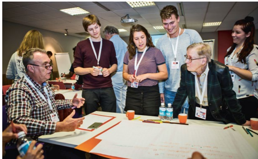
Ideeën uitwisselen op de Ambassadeursdag

Om deelnemers van de Vredesweek met nieuwe ideeën te inspireren, spoort PAX de komende tijd iedereen aan om op zoek te gaan naar zijn of haar verbeeldingskracht voor vrede. Sommigen denken al snel aan de acties van grote visionairs als Mahatma Gandhi, Rosa Parks, Nelson Mandela of Malala, maar inspiratiebronnen zijn ook dichterbij te vinden.