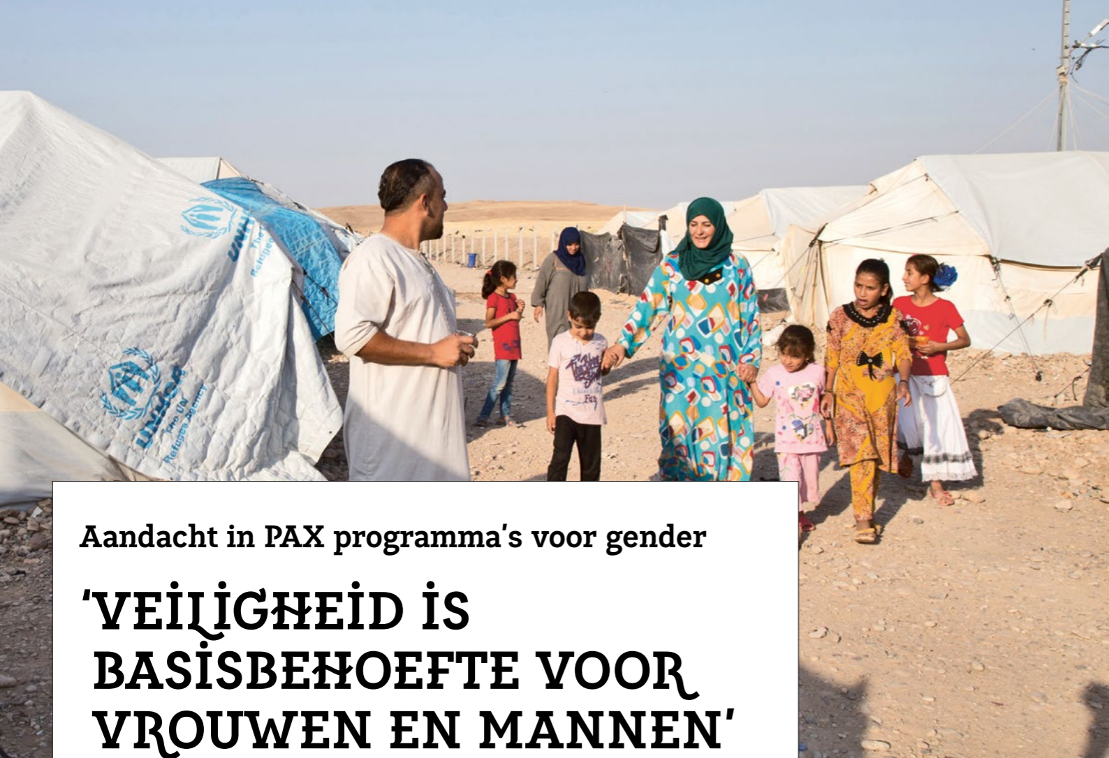
In een opvangkamp leef je vaak dicht op elkaar