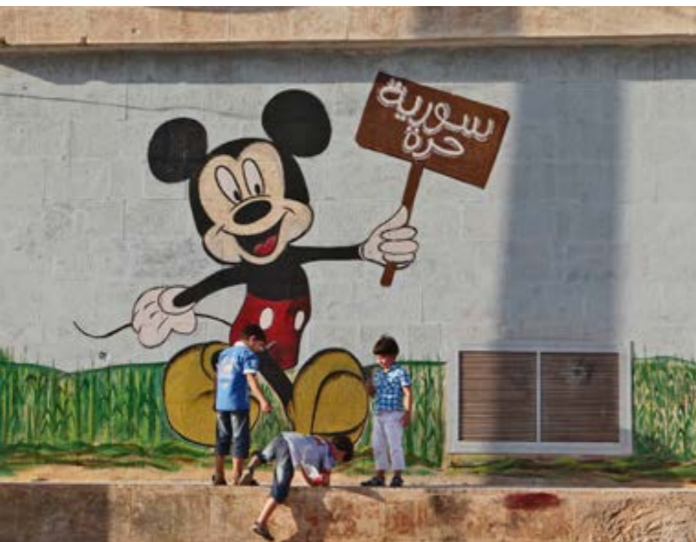
Mickey Mouse wil ook een 'Vrij Syrië'

belang, wordt de maatschappij werkelijk veiliger. Na de aanslagen in Londen in 2005 zei voormalig premier Tony Blair: "We laten onze open en vrije samenleving niet terroriseren." Na hem hebben politieke leiders uit andere democratische landen dit ook gezegd, maar diezelfde leiders namen toch een paar maanden later verregaande anti-terreurmaatregelen om het gedrag van hun eigen burgers te monitoren.