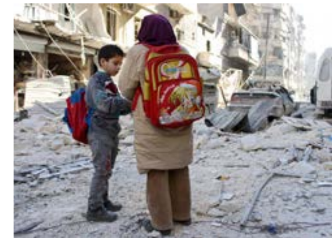
Schooll kinderen in Aleppo

kon de kerk me niet meer beschermen en na de dood van mijn moeder ben ik een paar maanden naar Engeland gegaan. Daar kon ik studeren. In Syrië had ik een opleiding voor tandarts gedaan, maar in Engeland ging ik politicologie en internationale betrekkingen studeren. De revolutie was inmiddels aardig op gang en ik voelde de drang om terug te keren naar mijn land. Dat deed ik via Turkije en zo kwam ik in het 'bevrijde' deel van Aleppo te wonen."