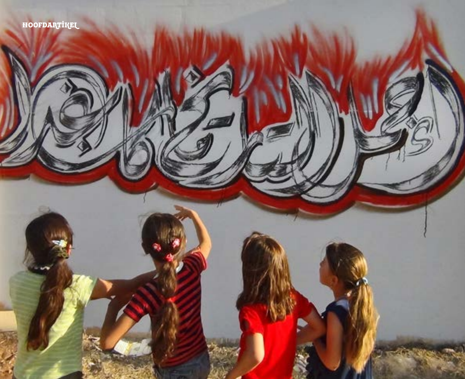
Meisjes uit Saraqeb bekijken 'verzetsgraffiti' op een muur van hun stad.