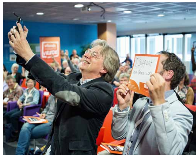
De steun voor PAX in de samenleving geeft ons nog meer zeggingskracht.