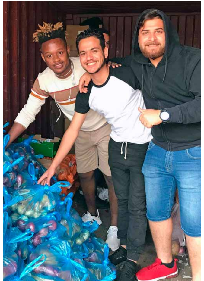
Samen met vrijwilligers eten uitdelen.

“Ja, dat punctuele heb ik nog niet onder de knie. Heb steeds