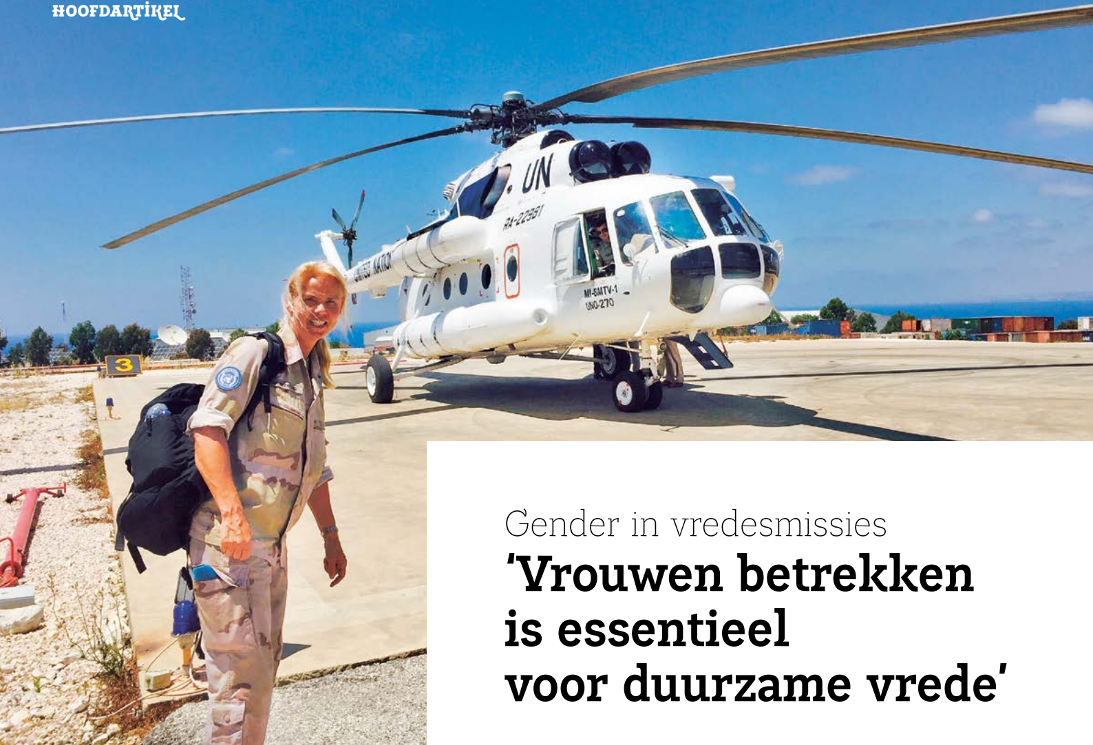
Gemiddeld is maar vier procent van de uitgezonden mensen vrouw