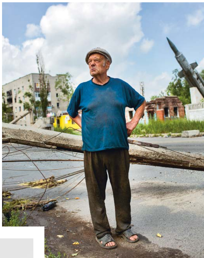
Voor alleenstaande gepensioneerden is het leven erg moeilijk

Ik stond in de rij om groente te kopen. Toen kwam er ineens heel hard een auto aanrijden waar mannen uitsprongen. Ze trokken een van de mensen uit mijn rij hun auto in. Iedereen stond verstijfd van angst en kon niets uitrusten. Mijn man was op dat moment in Moskou voor zijn werk. We besloten dat hij niet naar huis zou terugkeren, maar naar Charkov zou vliegen. Ik kon nog net een van de laatste treinkaartjes kopen en ben een week later vertrokken. Ik kon alleen een tas meenemen uit ons appartement.