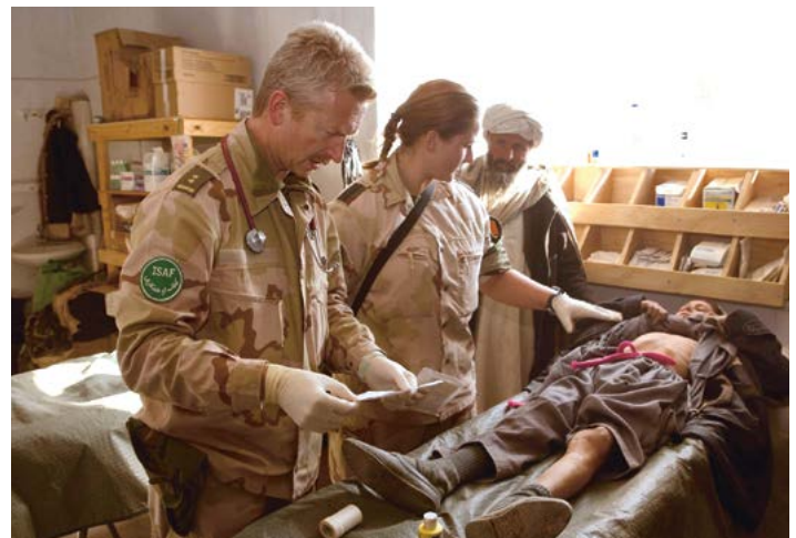
Nederlandse mannen en vrouwen samen op vredesmissie in Afghanistan

Sinds de resolutie in 2000 is aangenomen, is het bewustzijn voor 'gender' onder militairen zeker gestegen. De meeste militairen beseffen nu hoe belangrijk het is om in gemengde teams erop uit te gaan zodat er informatie van mannen en vrouwen kan worden ingewonnen. Sommige commandanten zeggen nu: "Had ik maar meer vrouwen in het bataljon." We praten als leger nog steeds te weinig met de andere 'helft', het vrouwelijk deel van de bevolking. We praten met burgemeesters, hoofden van politie en leger en religieuze leiders, maar dat zijn bijna altijd mannen. We kunnen ons nog meer inzetten om met vrouwen in contact te komen, naar hen te luisteren en ze de steun geven die ze nodig hebben om te kunnen deelnemen. Gemiddeld vier procent van ons personeel in de missies is vrouw. De VN wil dat ophogen naar 15 procent. Dat betekent dat de lidstaten meer vrouwen op uitzending moeten sturen. Dat is iets dat goed moet doordringen en daar blijf ik me hard voor maken." ♦