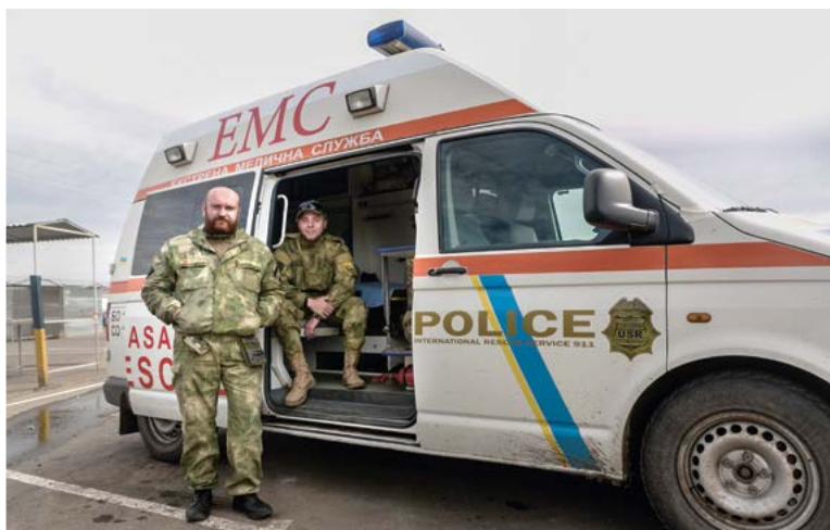
Eerste hulp aan militairen en soms aan burgers