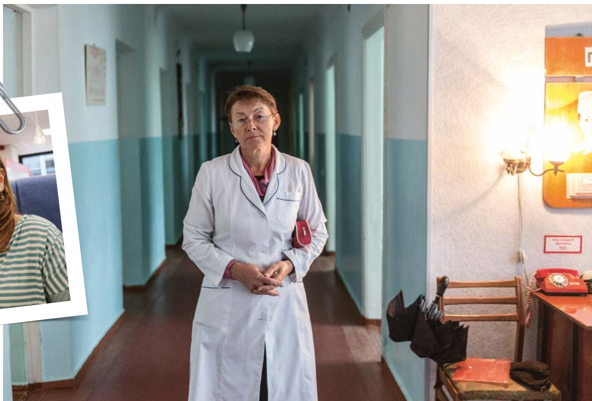
Je kunt vredesingenieur zijn naast je betaalde werk

Als je met Olga praat dan hoor je hoe een oorlog ongemerkt begint. Er is protest, er is een illegaal referendum over afscheiding. Zo lang zich dat in een stad ver bij je vandaan afspeelt, is het een ver-van-je-bed show. Tot bendes met fietskettingen mensen pal voor je deur in elkaar slaan. Dan realiseer je je dat het menens is.