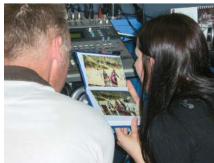
Het uitwisselen van foto's met overlevenden, bracht ook meer toenadering tussen nabestaanden en oud-soldaten.

Van den Berg: "We hebben de overlevenden en Dutchbatters uitgenodigd om hun eigen ervaringen op schrift te stellen en ter beschikking te stellen. Die kunnen later gebruikt worden voor geschiedschrijving, waarheidsvinding, uitbreiding van de tentoonstelling of nieuwe exposities. Terecht noemde de voorzitter van het bestuur van het herinneringscentrum de tentoonstelling 'een leven project'. Voor de realisatie van de tentoonstelling was een kleine drie jaar nodig maar het project heeft een lange voorgeschiedenis. Eerdere ontmoetingen tussen Dutchbatters en overlevenden waren zeker nuttig om iets van een basaal vertrouwen en respect op te bouwen.