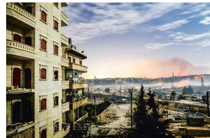
De stad waar Diana in woonde heeft veel te lijden gehad van de oorlog