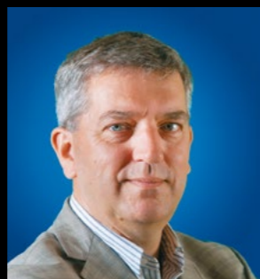
Peter Wijnga Instituut of Strategic Studies Den Haag

Emoties kunnen tot ongewenste handelingen leiden als er niet op een goede manier mee omgegaan wordt. Het is de verantwoordelijkheid van leidinggevend en van de politiek om militairen zo op te leiden die ongewenste handelingen te voorkomen. Die verantwoordelijkheid komt meteen 'onder vuur te liggen' als het om robots gaat. Een machine kan niet aansprakelijk worden gesteld voor zijn handelingen, maar wie dan wel? Degene die de robot maakte? Of degene die hem programmeerde? Ik ben zeker niet tegen de implementatie van technologische ontwikkelingen. Maar het wordt problematisch wanneer de mensen die de techniek ontwikkelen, niet tegelijkertijd nadenken over de morele consequenties van deze techniek. Zolang wij geen morele oordelen in robots kunnen programmeren, moeten volledig autonome wapens er niet komen.”