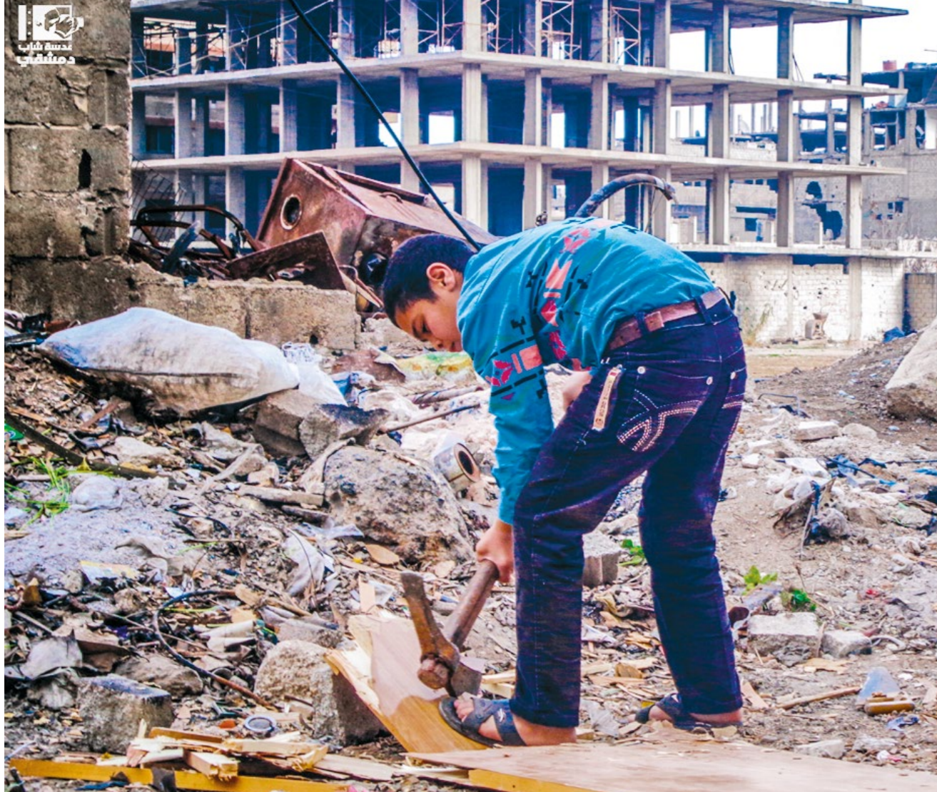
In Syrië is de situatie in sommige gebieden na maandenlange belegering zo erg dat alles wordt gebruikt voor brandhout.