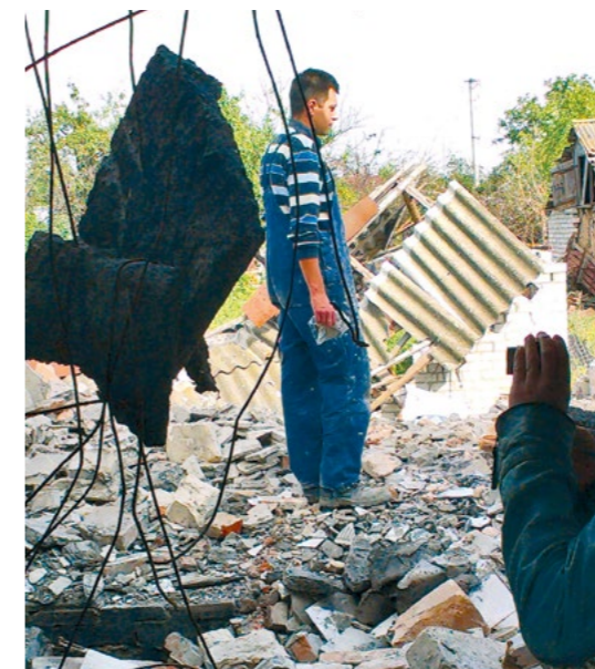
Man bij ruïne van zijn huis.