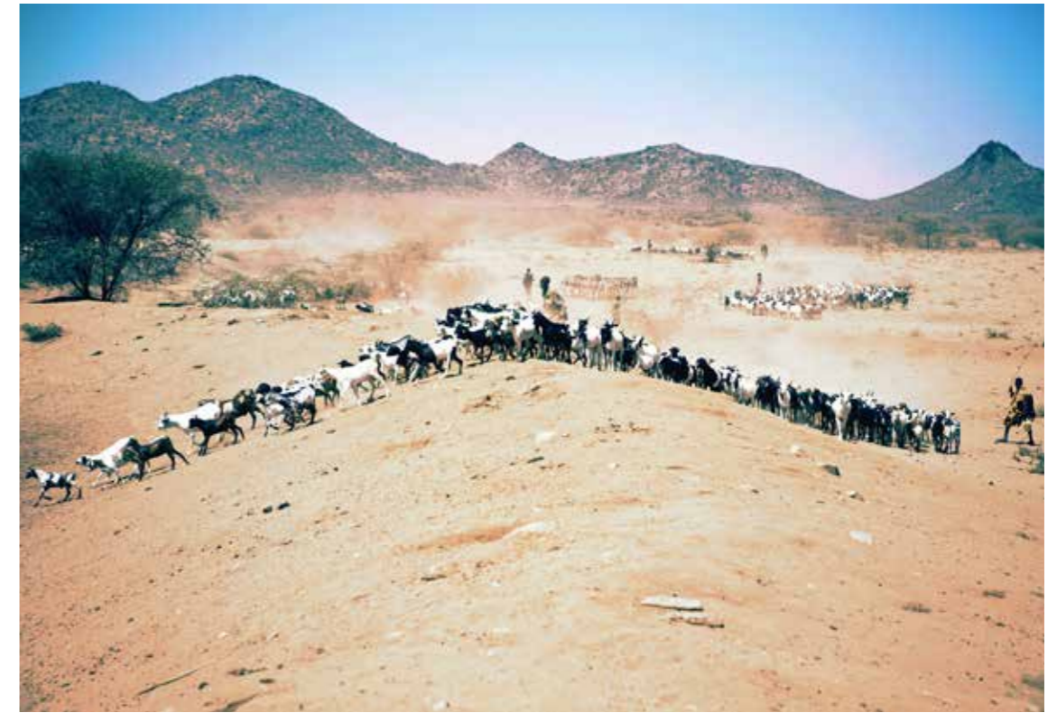
Herders onderweg met hun vee in het uitgestrekte en afgelegen grensgebied van Zuid Soedan en Kenia