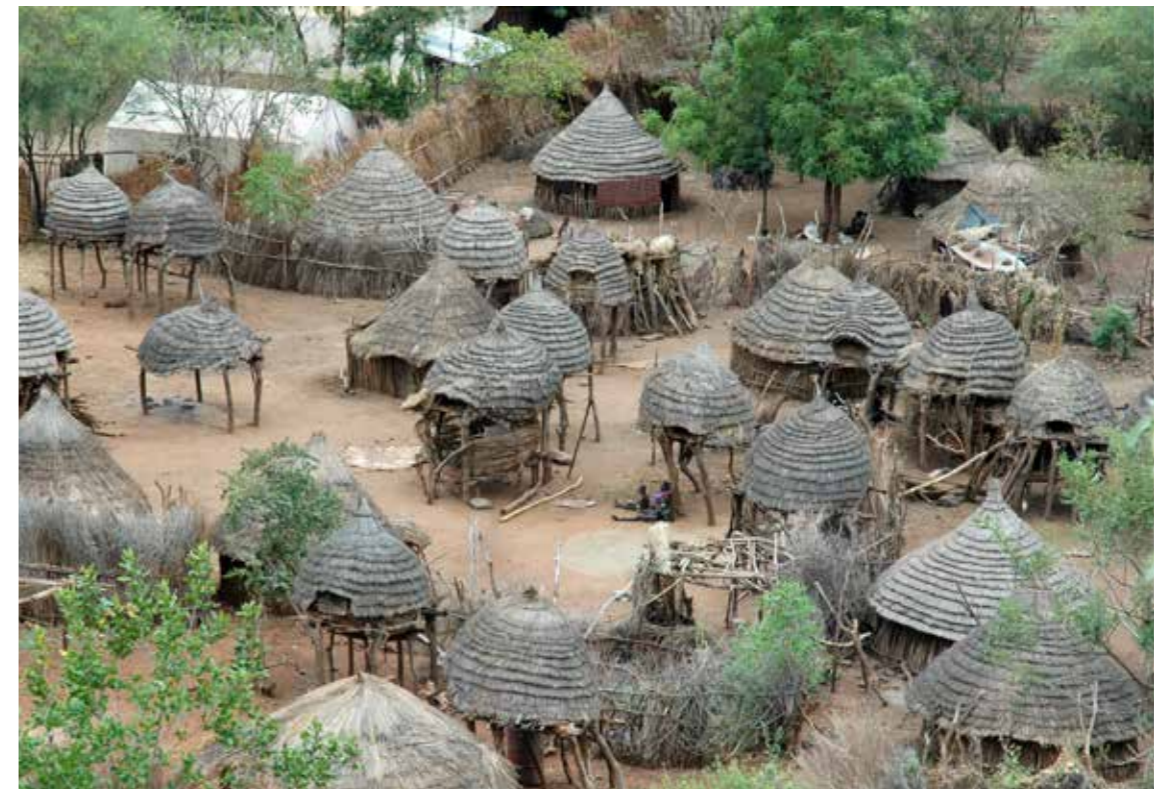
Toposa erf in Kuron Peace Village, Zuid Soedan

Als meest gerespecteerde vredesvoorvechter van zijn land is Taban gezegend met een onuitputtelijk optimisme, durf, grote stressbestendigheid, en een bijna onmenselijk opofferingsvermogen.