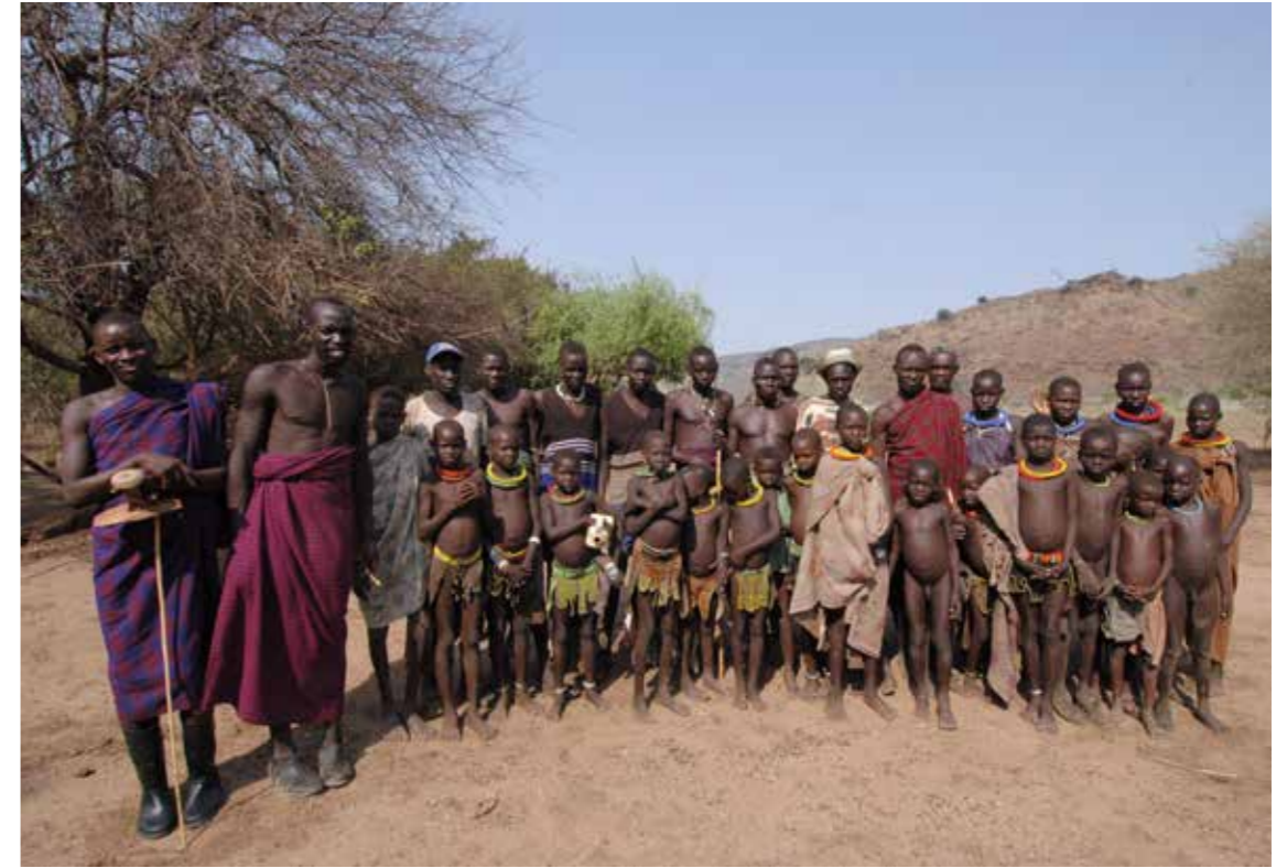
Een groep van jonge herders die samentrekken met hun vee op zoek naar water en grasland