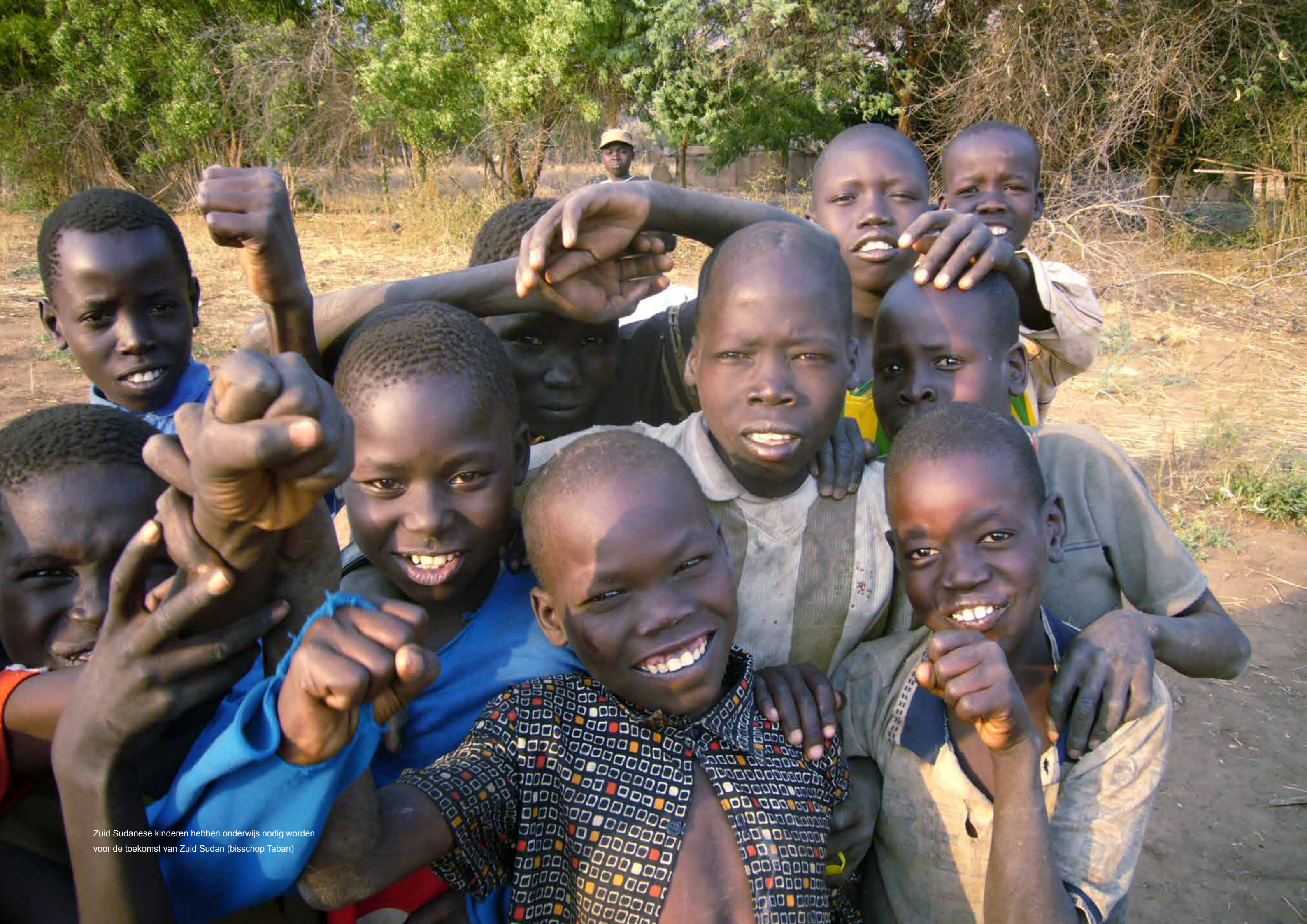
Zuid Sudanese kinderen hebben onderwijs nodig worden voor de toekomst van Zuid Sudan (bisschop Taban)