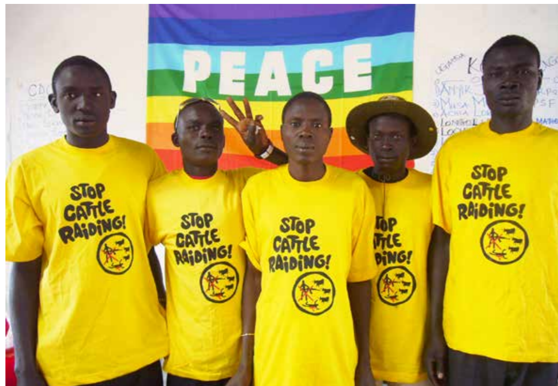
Jonge krijgers toegewijd aan vreedzame transformatie van hun gemeenschappen tijdens een cross-border peace & sports training