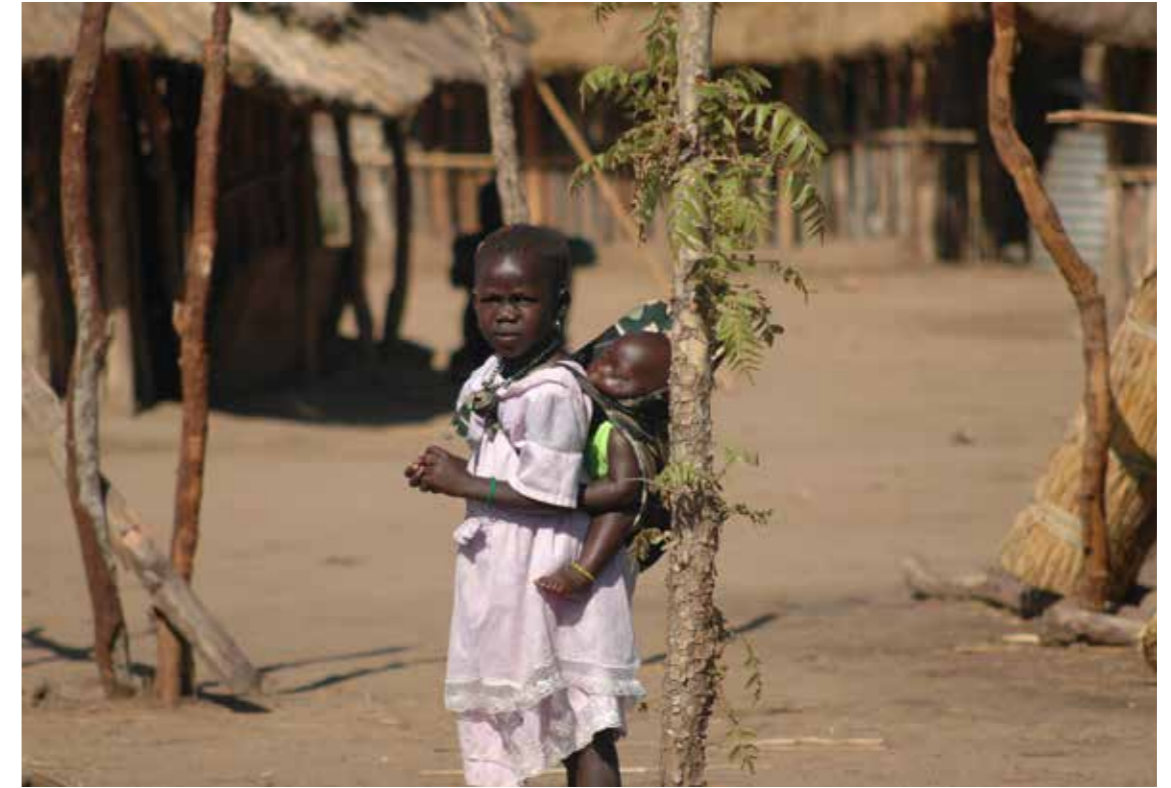
Een kind zorgt voor haar broertje op het platteland

South Sudan CRS 1974-1976, LWR 1976-1978, Sudan Country Director SCF/US 1986-1990 e-mail: ed@WorldPossible.org cell: +1 917 836-1183