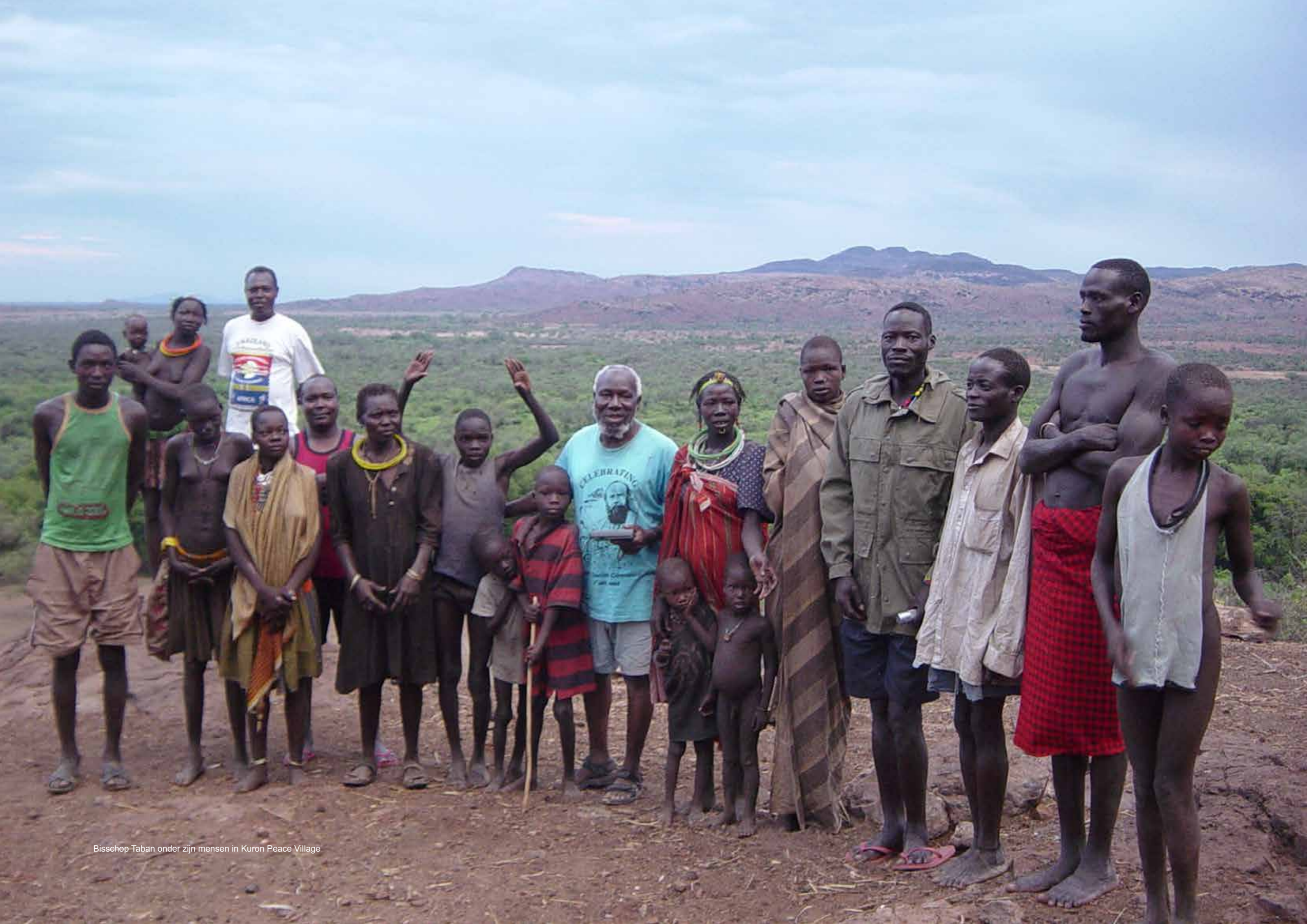
Bisschop Taban onder zijn mensen in Kuron Peace Village