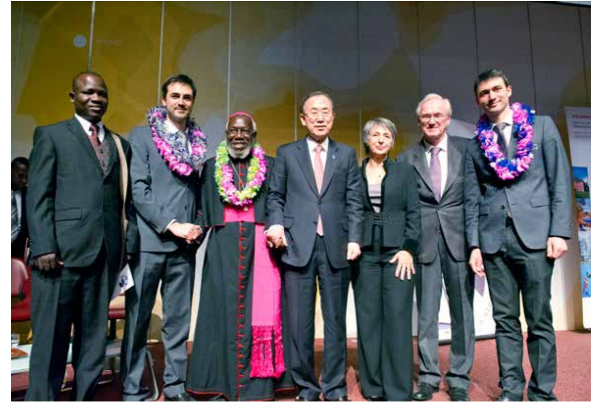
Bisschop Taban ontvangt in 2013 de VN Sergio Vieira de Mello Prize voor zijn inspanningen in het bevorderen van vrede