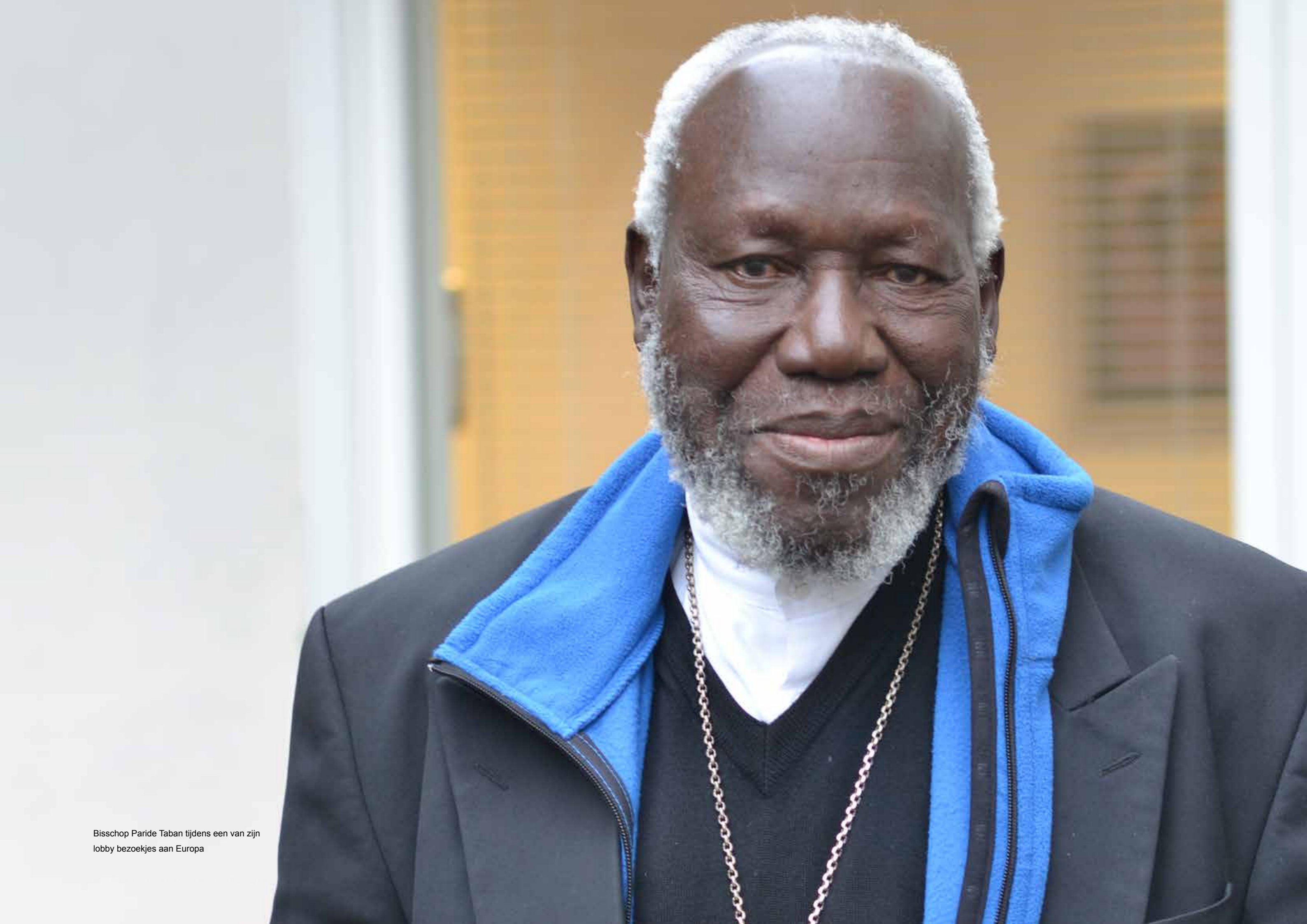
Bisschop Paride Taban tijdens een van zijn lobby bezoeken aan Europa