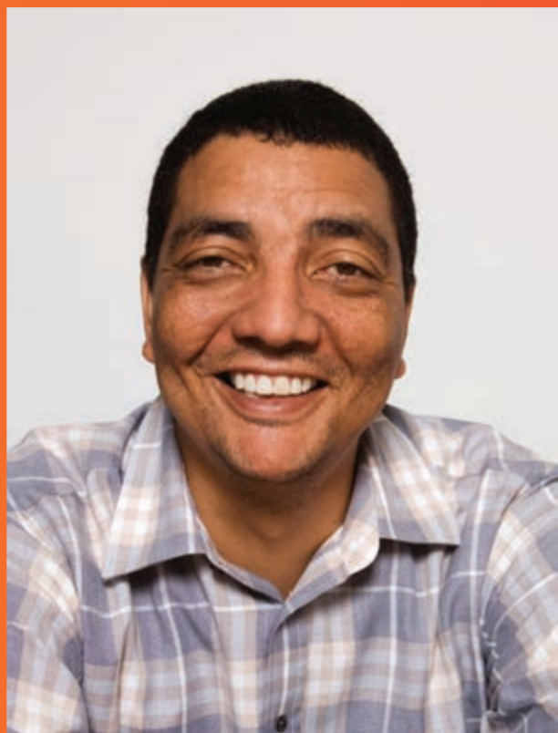
Jörgen Raymann: "Ik wil werken aan een samenleving waarin we een ander gunnen wat we zelf ook hebben."

Jörgen Raymann (1966) is cabaretier, televisie-presentator en motivational speaker. Hij werd in Amsterdam geboren, maar groeide op in Suriname. In de jaren tachtig maakte hij daar het militaire bewind onder Bouterse mee. Later keerde hij terug naar Nederland om aan de Erasmus Universiteit Rotterdam economie te studeren. Hij is vooral bekend van het late night programma Raymann is Laai, nu getiteld 'zo: RAYMANN', waarin Tante Es al meer dan 10 jaar de show steelt. Diversiteit is een vast thema. Zondag 16 september 2012 is het programma weer terug op tv. Jörgen is onder andere ambassadeur van Unicef en Stichting Giving Back en heeft hij zijn eigen stichting, het PIET-fonds, dat staat voor Poor Infant Equality Trust-fund dat kinderen met een hepaalde wens op cultureel en/of educatief gebied ondersteunt.