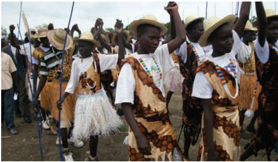
Een optocht tijdens de Internationale Dag van de Vrede in Malakal, Zuid-Soedan.

In Libanon speelden Libanese tv-sterren en bekende oud-basketballers een basketballwedstrijd om aandacht te vragen voor vrede. In Georgië werden in de aanloop naar de Internationale Dag van de Vrede kenniscompetities en lezingen over vrede en ontwikkeling gehouden voor studenten van hoge scholen en universiteiten. In diverse steden mensen gaan mensen de straat op met zelfgemaakte witte duiven op houten stokken. Dat gebeurt onder andere in Washington, Barcelona, Los Angeles, Madrid, Brussel, New York City, Chicago, Rome, Dar es Salaam, Toronto, Hong Kong, Singapore, Londen en Wenen.