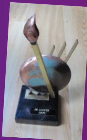
De winnaar ontvangt een beeldje van de Luciferprijs.