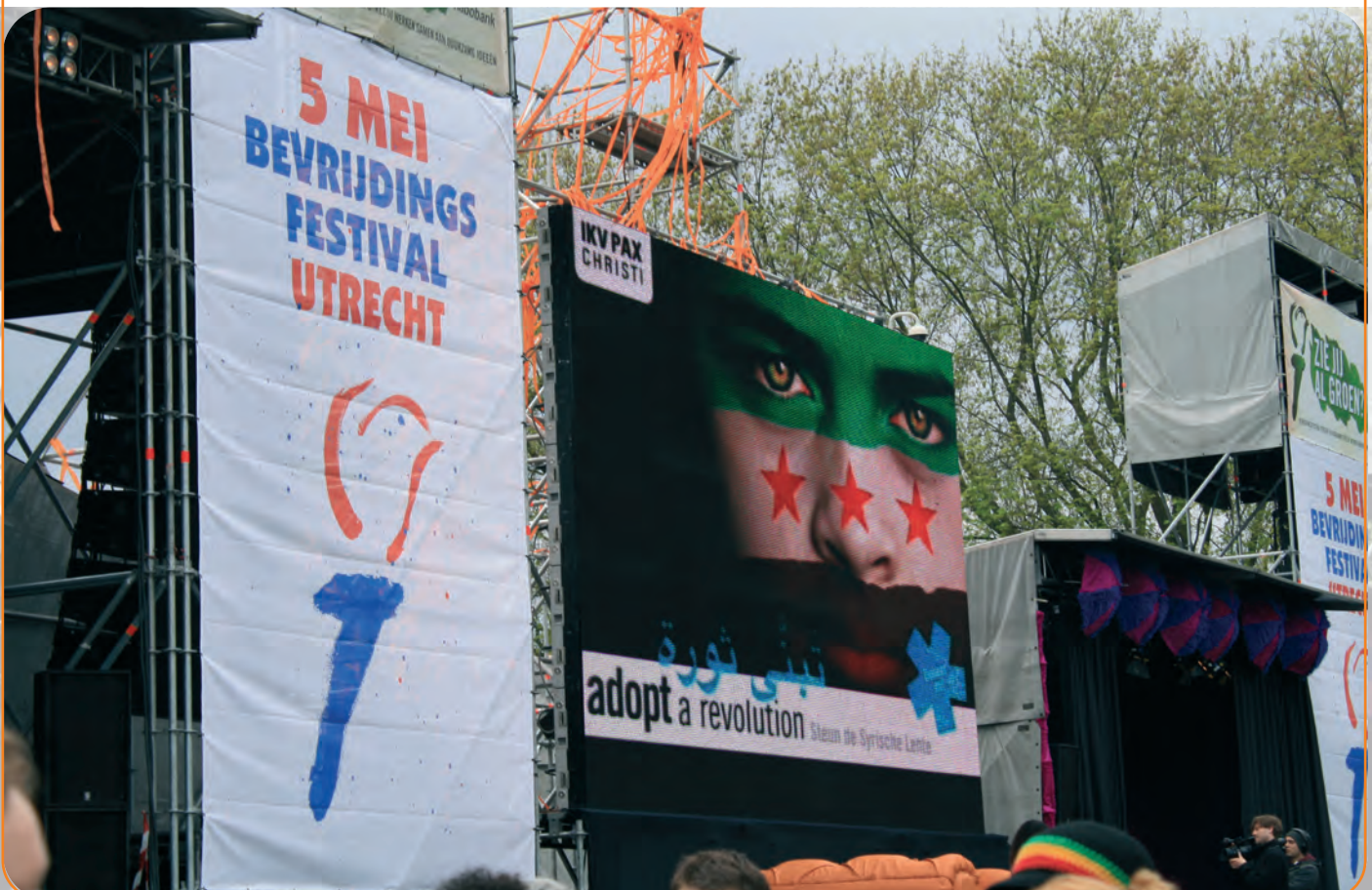
Op Bevrijdingsfestival 2012 vroeg IKV Pax Christi aandacht voor de campagne Adopt a Revolution

In 2012 is de campagne Powered by Peace over de problematiek van grondstoffen en conflict van start gegaan. De campagne creëert enerzijds bewustwording en biedt anderzijds mogelijkheden voor concrete actie door Nederlandse burgers.