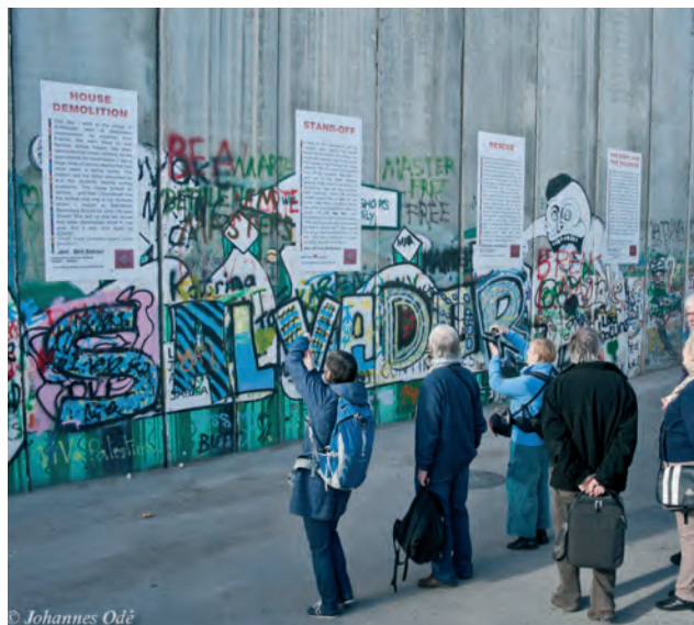
Pelgrimagetocht naar Israël en de bezette gebieden

het Arab Peace Initiative komen lokale vredesactivisten in de regio bijeen. Ook Palestijnse vluchtelingen worden in deze activiteiten betrokken.