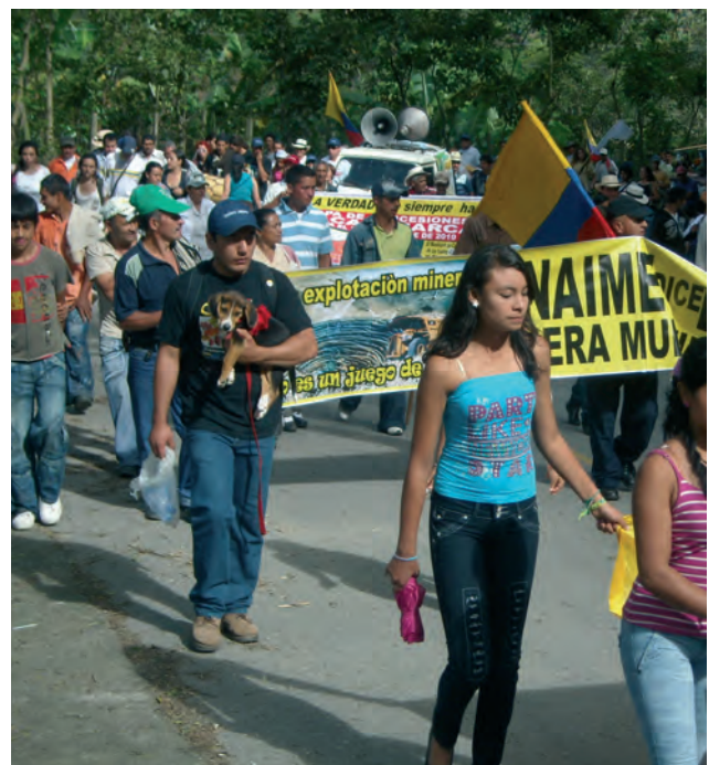
Protestmars in Anaima, Cajamarca, Colombia, tegen de komst van een goudmijn