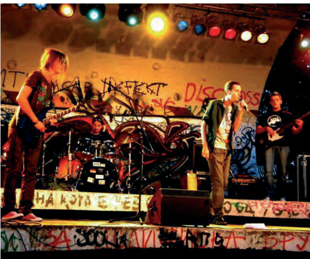
De Mitrovicia Rock School rockt tijdens een optreden