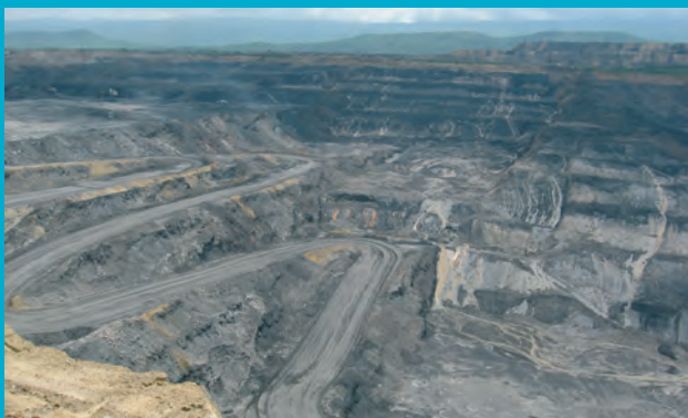
Uitzicht op een goudmijn in Cerrejon, Colombia

De Nationale Postcode Loterij heeft het in 2012 onder andere mogelijk gemaakt om het programma Powered by Peace te realiseren; een programma bestaande uit een internationale campagne, publieksactiviteiten in Nederland en projecten in Colombia. Grondstoffen zoals steenkolen zijn vaak de oorzaak van conflict en mensenrechtenschendingen in plaats van een bron van welvaart en vrede. Regelmatig gaat de exploitatie gepaard met mensenrechtenschendingen. Wij gaan niet alleen met de slachtoffers van dit conflict in gesprek, wij brengen ook de mijnbouwbedrijven en de lokale overheden aan de tafel. Om dit programma meer power te geven is ook draagvlak binnen de Nederlandse samenleving - van burgers, het bedrijfsleven en de politiek - onontbeerlijk. Dit draagvlak uit zich in het besef dat mensen in conflictgebieden evenveel recht hebben op vrede en veiligheid als wij in Nederland hebben.