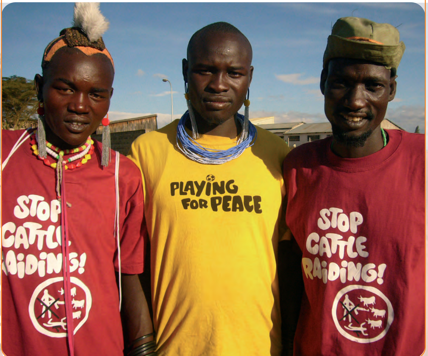
Voetballers die voor Peace & Sports in actie komen