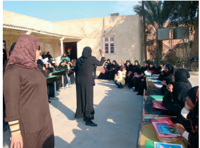
Vrouwen actief in vredesprogramma Irak

met de rechten van minderheden, in de vorm van debatten, kunst, sportevenementen en campagnes. Zowel op nationaal als regionaal niveau vinden er uitwisselingen plaats tussen jongeren, waardoor tolerantie en acceptatie van de ander wordt gestimuleerd.