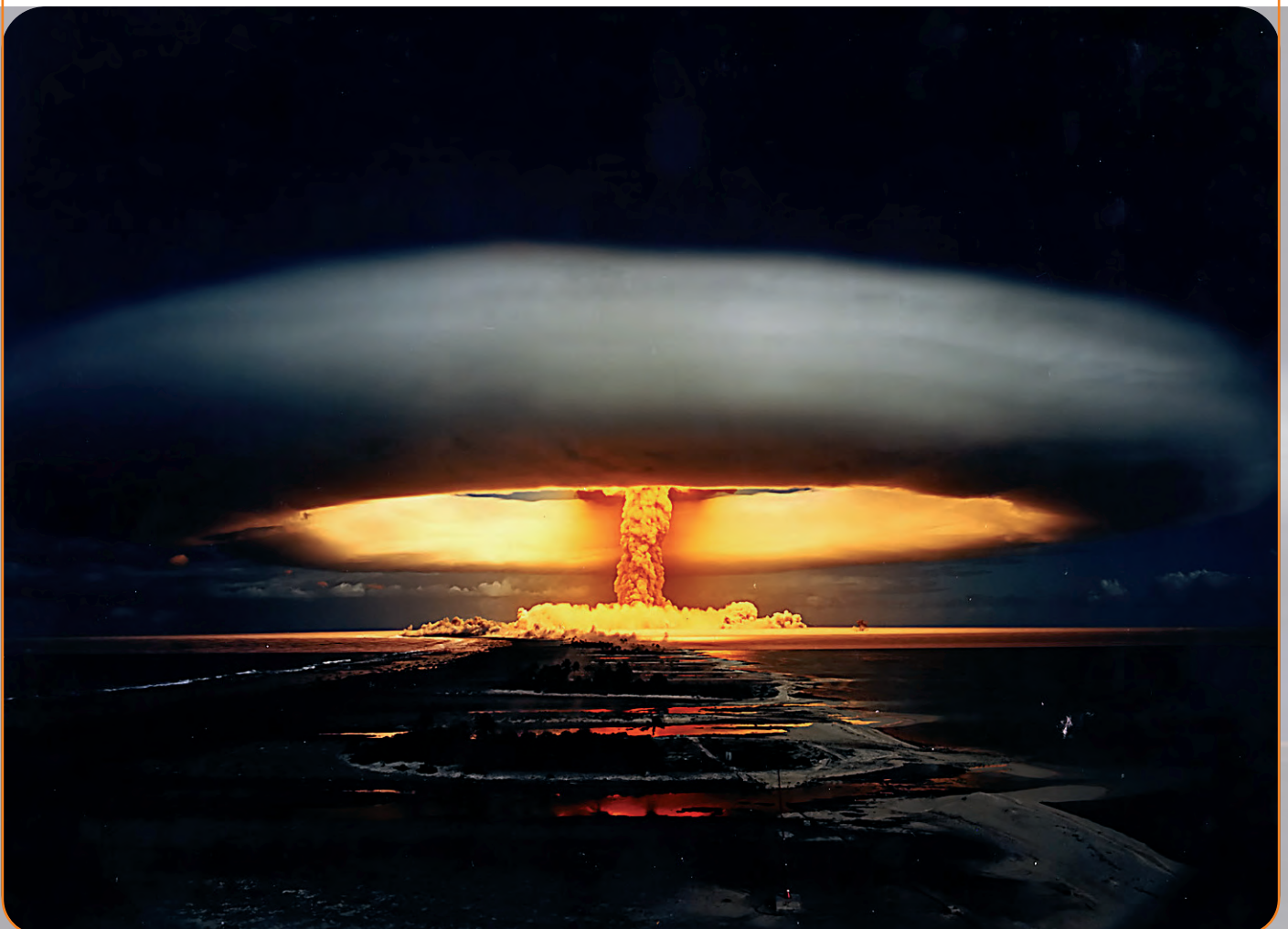
Met de campagnes NoNukes vraagt IKV Pax Christi aandacht voor nucleaire ontwapening.

Het No Nukes-team van IKV Pax Christi werkt aan een kernwapenvrije wereld. Met behulp van onderzoek, lobby en campagnes vraagt IKV Pax Christi aandacht voor nucleaire ontwapening. Internationale veiligheid en kernwapens staan weer hoog op de politieke agenda.