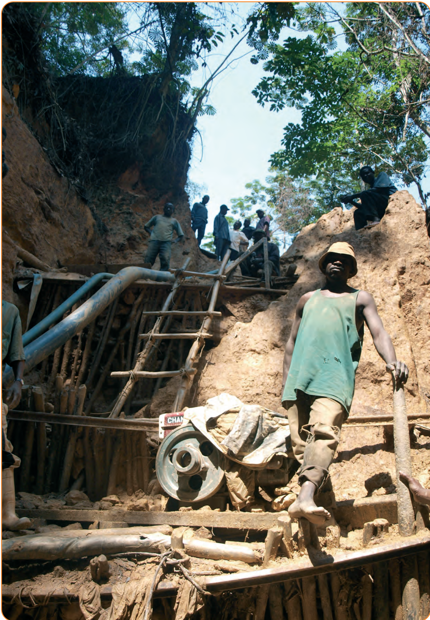
Goudmijnwerkers in in DR Congo