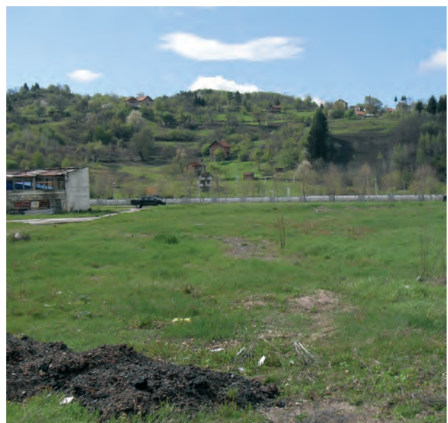
Het voormalig Dutchbat compound Potocari, Srebrenica waar in 2012 het massagraf werd gevonden