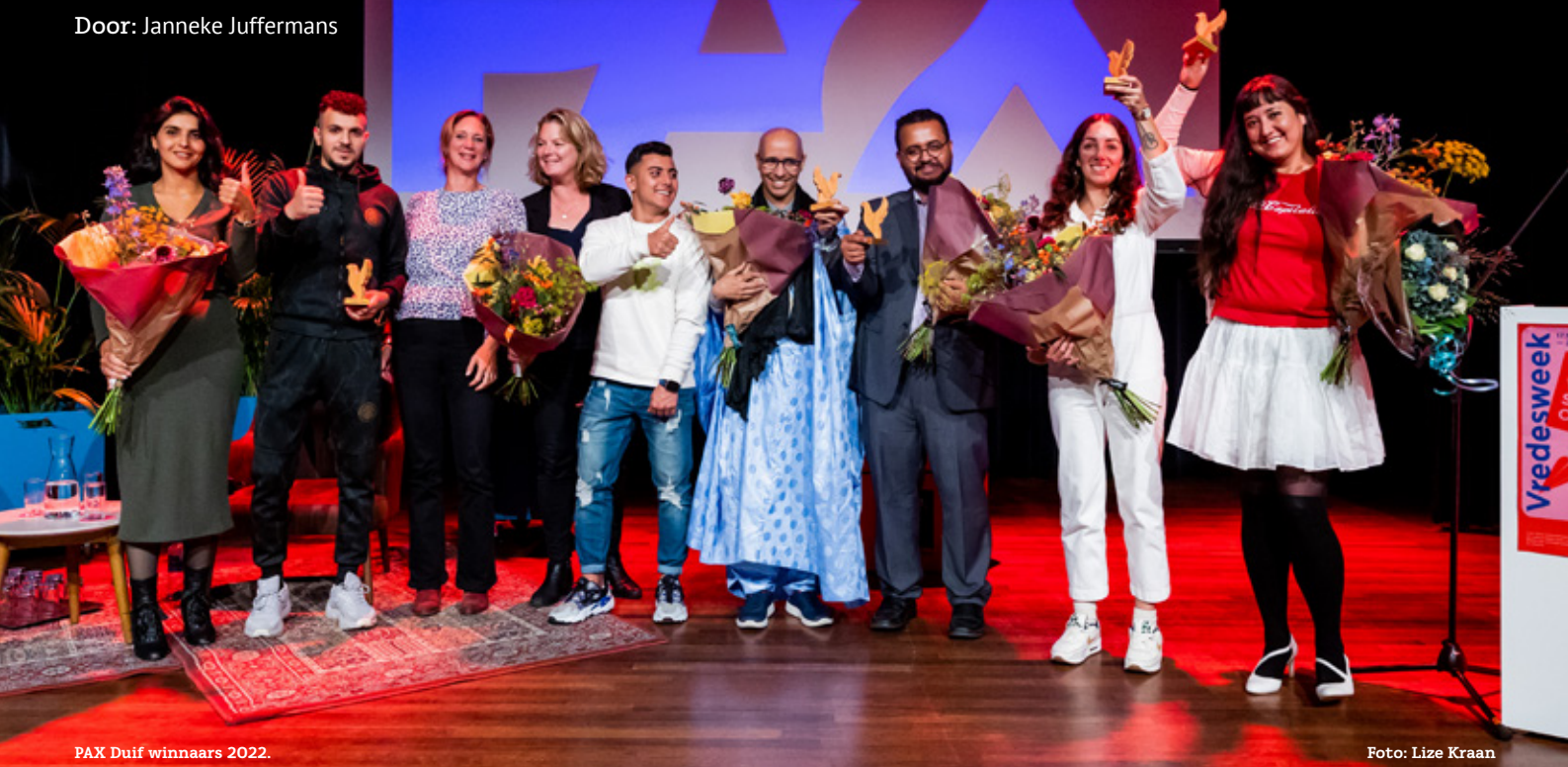
PAX Duif winnaars 2022.