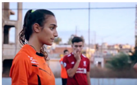
Jongeren in Palestina.