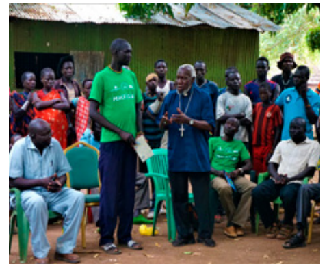
Overleg met slachtoffers in Zuid-Soedan.