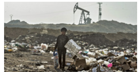
Vervuild Syrie worstelt met ernstig watertekort.