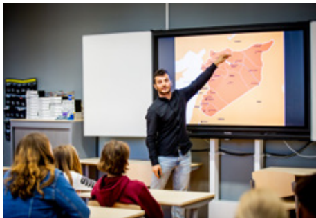
'Verhaal van mijn vlucht' in de klas.