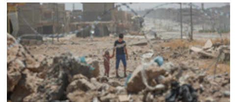
Meeste slachtoffers explosieve wapens in bevolkte gebieden zijn burgers.