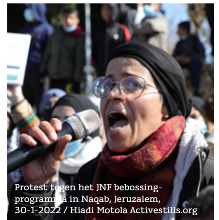
Protest tegen het JNF bebossing-programma in Naqab, Jeruzalem, 30-1-2022