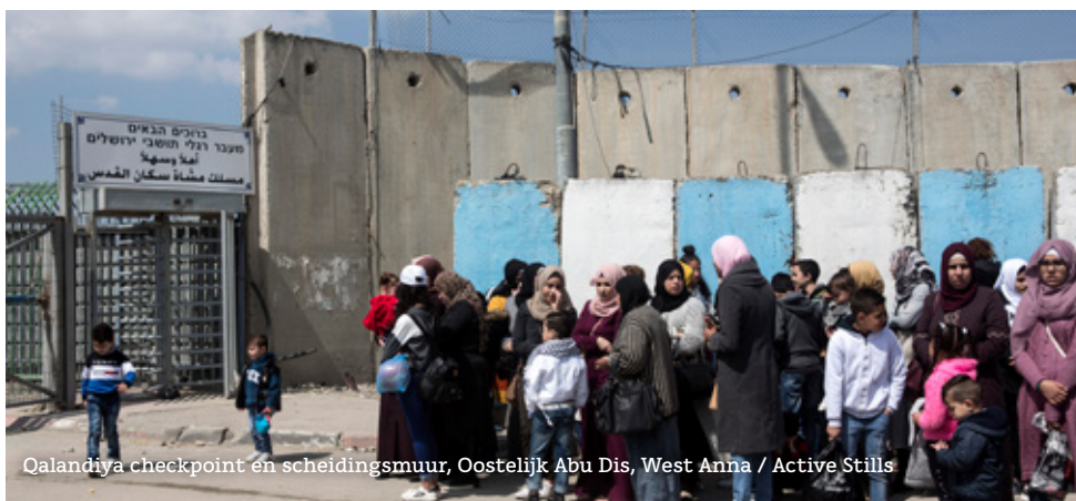
Qalandiya checkpoint en scheidingsmuur, Oostelijk Abu Dis, West Anna

"Ik overleefde als klein peutertje van 2 Bergen-Belsen. Ik ging er met mijn ouders in en kwam er als wees vandaan, sterk verzwakt door TBC. Ik heb gedurende mijn hele leven, ik word dit jaar 80, me altijd het lot van mensen die het nodig hebben aangetrokken, daarom werd ik maatschappelijk werker. Ik ben vast door mijn verleden beïnvloed, maar misschien zit het ook wel in mijn genen. Acht jaar geleden werd ik voorzitter bij SIVMO. Ik vind dat je ieder conflict van twee kanten moet bekijken. Dat geldt ook voor het conflict tussen Israël en Palestina. Als je teruggaat in de geschiedenis dan begrijp je wat de wortels zijn van dit conflict en ook waarom Palestijnen niet in hun bestaan bedreigd mogen worden. Niemand overigens. Maar wat er nu in de bezette gebieden gebeurt is een bedreiging van burgers, een regelrechte oorlog." ♦