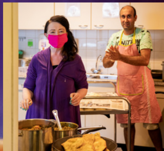
In Nijmegen werden Vredesmaaltijden gekookt die af te halen waren.