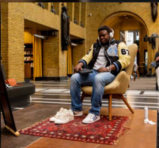
Tijdens de Vredesweek konden mensen letterlijk in de schoenen van een activist staan en luisteren naar wat zij meemaken.

Deze greep uit al die Vredesweekactiviteiten laat zien hoe creatief en vindingrijk de vredesambassades, lokale organisaties en initiatieven en alle deelnemers dit jaar invulling gaven aan de Vredesweek, ondanks alle belemmeringen. Wij kijken uit naar volgend jaar! ♦