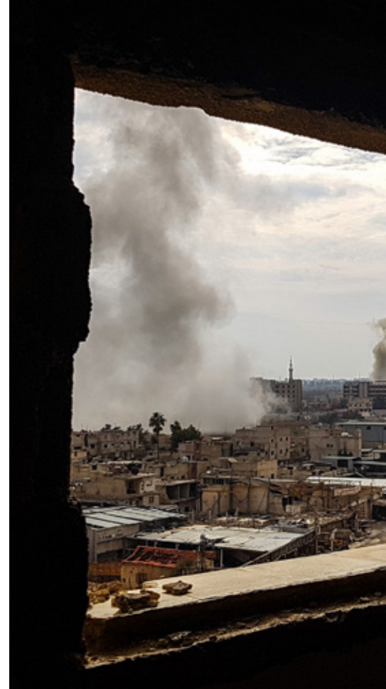
Ook in Douma, Syrië, zijn explosieve wapens gebruikt.

Vandaag de dag is de stad nog steeds aan het herstellen. Van de langdurige ISIS-controle over het gebied, maar ook van de blijvende impact van de Nederlandse luchtaanval op het dagelijks leven. Want niet alleen de explosie, doden en gewonden zorgden voor een schok. Al Jabouri: "Tel daarbij op het verlies van hun huizen,