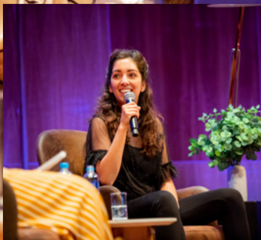
Sterke pleidooien en goede discussies tijdens PAX Power to the People.

Op zestien plaatsen in Nederland werd ook dit jaar een Walk of Peace georganiseerd: een wandeling van en voor vrede die mensen samenbrengt, ondanks én juist om hun verschillen. Voor het samen wandelen met de coronabeperkingen waren creatieve oplossingen gevonden om toch samen de straat op te gaan. Zo werd bij