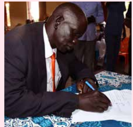
▲ Dinka- en Nuer-gemeenschappen onderteken 21 resoluties