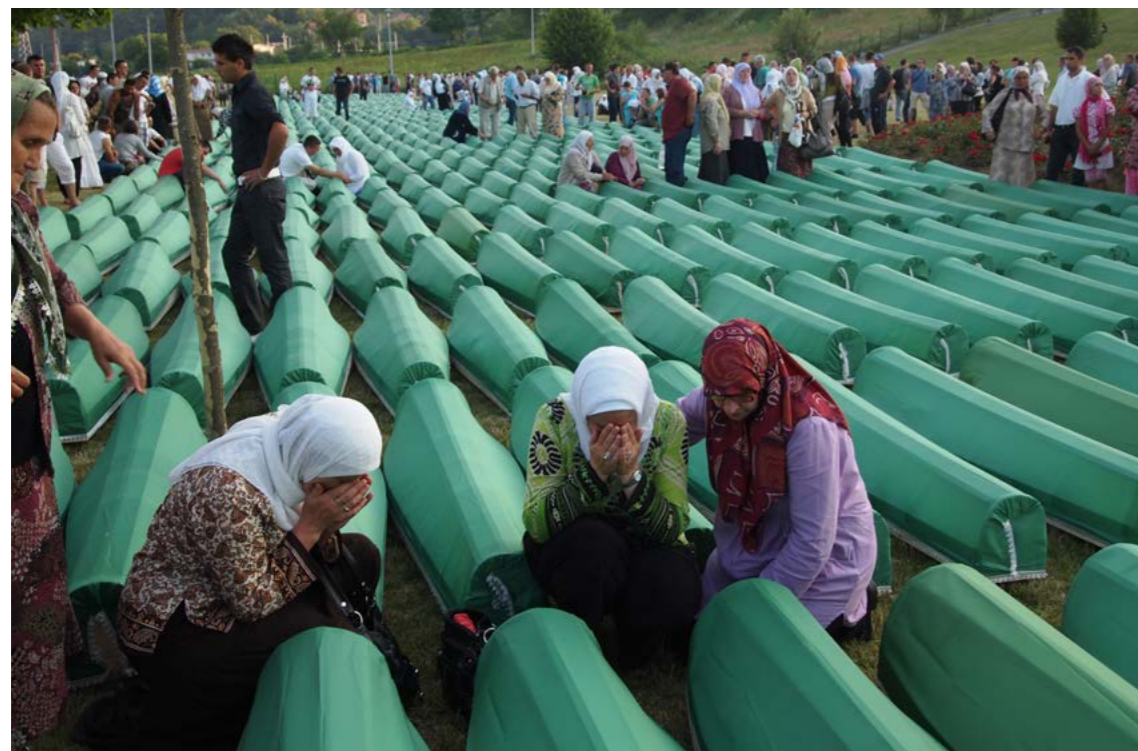
Slika 6: Svake godine 11. jula na posebnom mezarju u Potocarima sahranjuju se posmrtni ostaci koji su identifikovani u prethodnih dvanaest mjeseci.