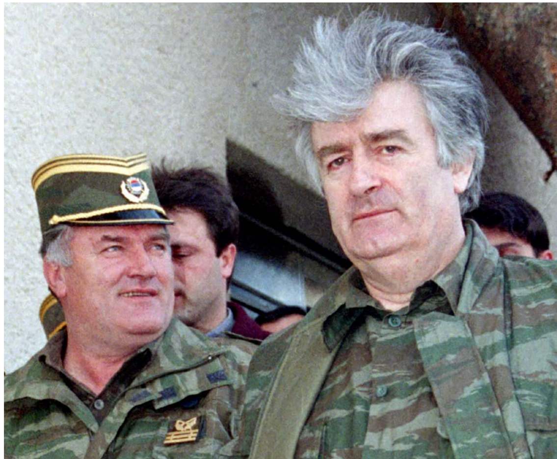
Slika 3: Ratko Mladić i Radovan Karadžić, za vrijeme rata.

područjem u kojem su civili mogli biti sigurni pod zaštitom snaga UN-a. Kanađani su odradili prvu smjenu, a početkom 1994. Holandija je poslala svoj prvi mirovni bataljon u Srebrenicu. Godinu dana kasnije tamo je stigao Holandski bataljon 3. Njihov komandant Karremans rekao je kasnije da je važno da se Srbi ne uznemiravaju previše. Holandski bataljon nije bio adekvatno naoružan tokom opsade Srebrenice; štaviše, u enklavi je bilo prisutno samo 429 holandskih vojnika.