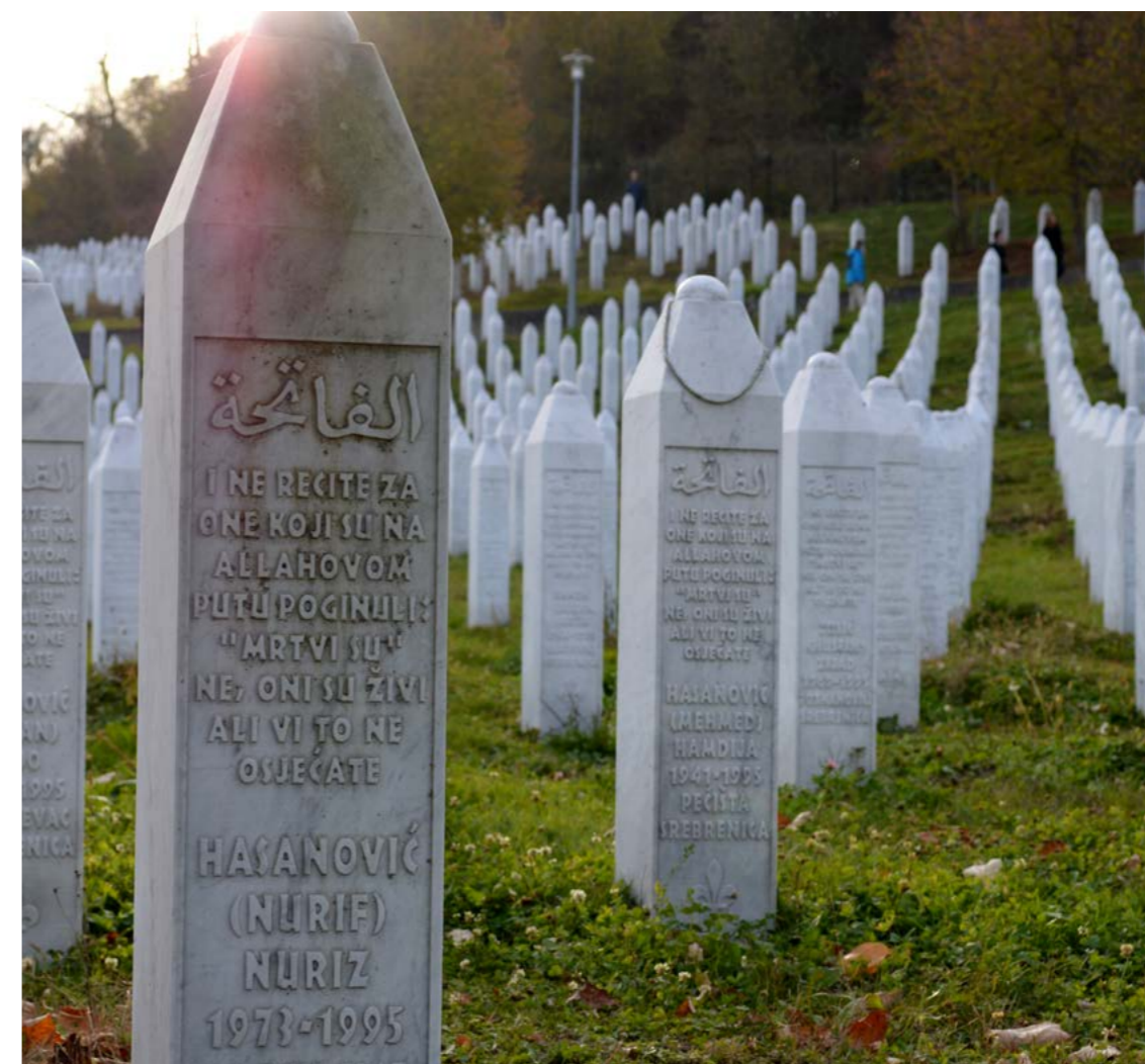
Slika 12: Mezarje u Potočarima za žrtve genocida. Do sada su ukopane 6.652 žrtve.

U Holandiji ili međunarodnoj zajednici poklanja se malo pažnje posljedicama 'Srebrenice'. Nisu napravljena ni poređenja sa (neuspjelim ili problematičnim) mirovnim misijama na nekim drugim mjestima. Ne pominju se ni političke posljedice neuspjele mirovne misije niti činjenica da sada u Holandiji postoji velika bosanska zajednica. Pravne posljedice genocida nisu predstavljene u nastavnim materijalima: npr. da je u Hagu osnovan sud za suđenje ratnim zločincima ili presude holandskih sudija u sudskim procesima koje je rodbina žrtava pokrenula, s uspjehom, protiv holandske države. Moralna ili etička pitanja koja se odnose na političku i vojnu odgovornost za događaje koji su prethodili julu 1995. nisu dio zastupljenosti 'Srebrenice' u nastavnim materijalima.