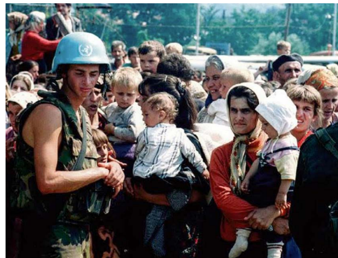
Slika 9: Izbjeglice (bosanski muslimani) čekaju na transport iz Srebrenice nakon što je grad zauzet od strane Bosanskih Srba (fotografija iz 1995).