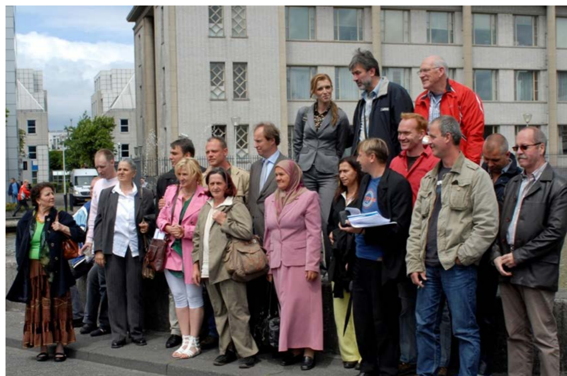
Slika 7: U junu 2009. PAX je organizovao zajedničku posjetu za preživjele Srebrenice i veterane Holandskog bataljona Haškom Tribunalu.

Uramljivanjem nacionalne prošlosti u šematske narativne šablone, različiti događaji iz prošlosti mogu se shvatiti kroz jedan narativ. Na primjer, težnja određene nacije za slobodom može se pojaviti kao motiv u ispričanim interpretacijama prošlosti kao i pokušajima da se savlada neprijatelj, ili u potrebi za priznavanjem žrtve.