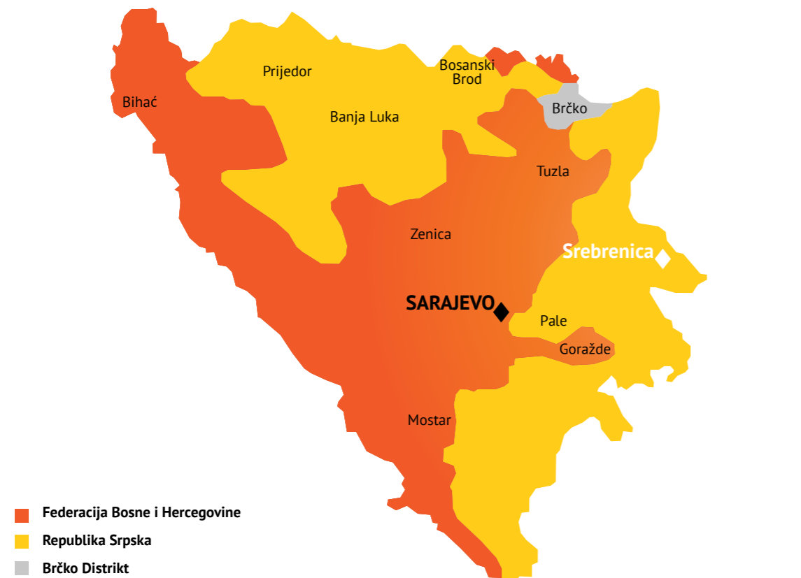
Slika 5: Dejtonskim mirovnim sporazumom (novembar 1995.) uspostavljena su dva entiteta u Bosni i Hercegovini. Srebrenica je smještena u entitetu Republika Srpska