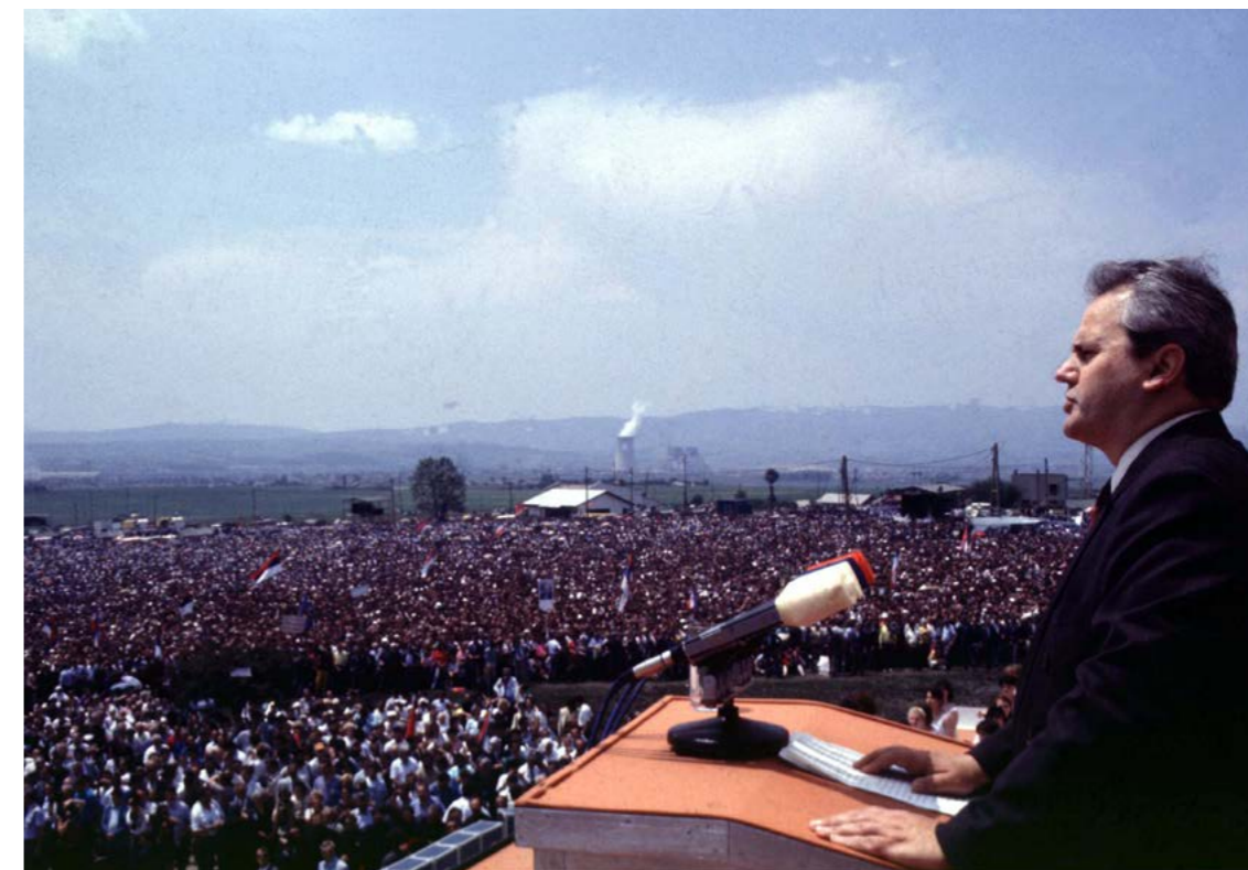
Slika 1: Milošević na mitingu u Kosovu Polju, Kosovo, u 1989.

Regija oko Srebrenice bila je od strateškog značaja za Srbe pošto se bez nje nije moglo ostvariti teritorijalno jedinstvo u okviru novog srpskog entiteta Republike Srpske. Zbog toga su Bošnjaci prisilno protjerani iz područja u kojima su živjeli u Istočnoj Bosni, a njihove kuće i džamije su uništene. Nakon toga Srebrenica je u proljeće 1993. proglašena Zaštićenom zonom UN-a: