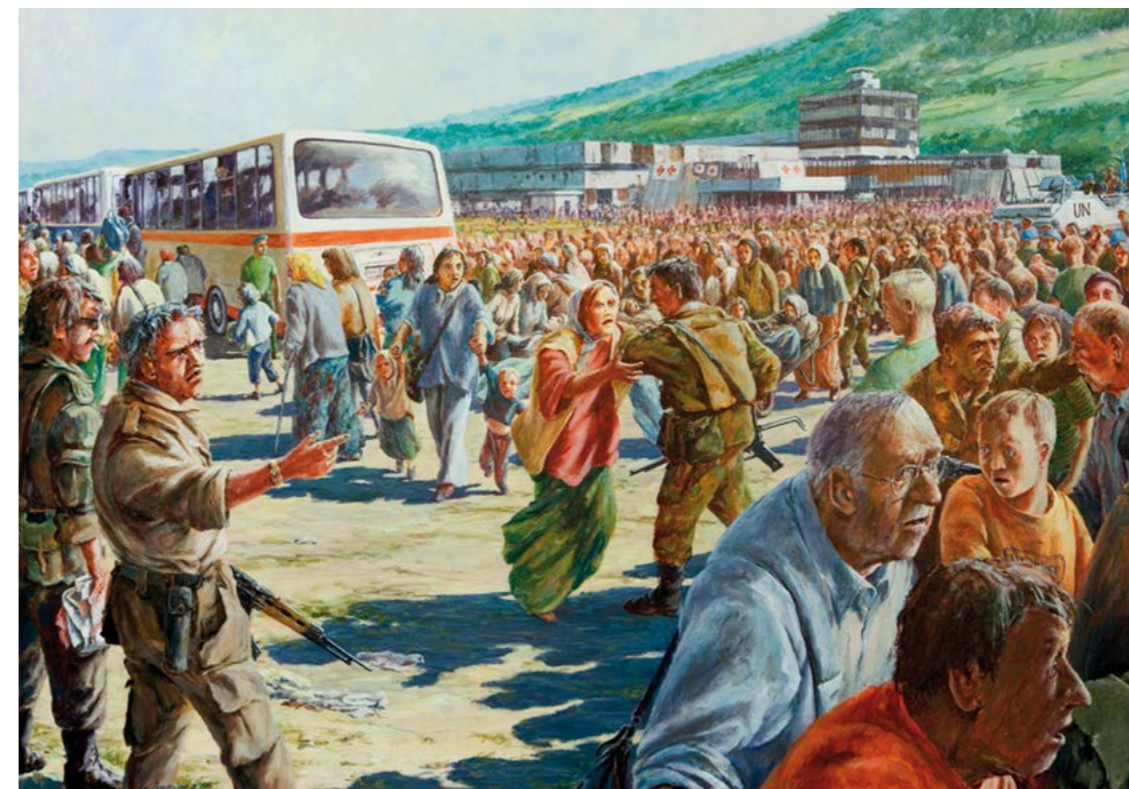
Slika 8: Školski poster koji je dio kanonskog prozora o Srebrenici.

Neke studije su pokazale hijerarhiju u viktimizaciji patnje i nasilja u ratu. Zašto se neke žrtve rata lako pamte u kolektivnom sjećanju dok druge ostaju skrivene decenijama? Njemačka naučnica Aleida Assmann napravila je razliku između dvije kategorije žrtava koristeći latinske izraze sacrificium i victima . Žrtve prve kategorije bili su ljudi koji su se žrtvovali za tobožnju 'pravednu stvar':