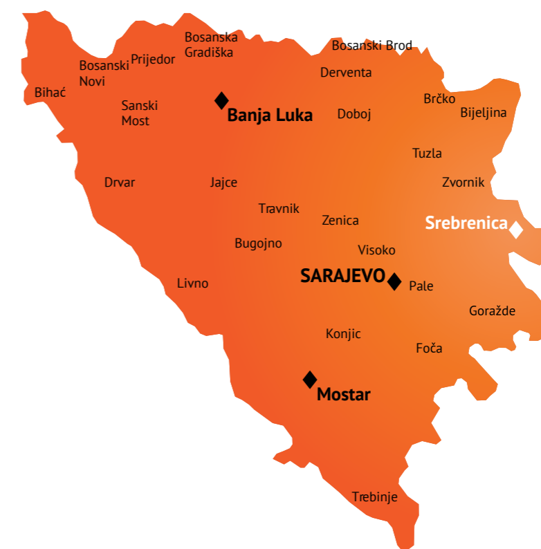
Slika 2: Karta Bosne i Hercegovine, 1992.