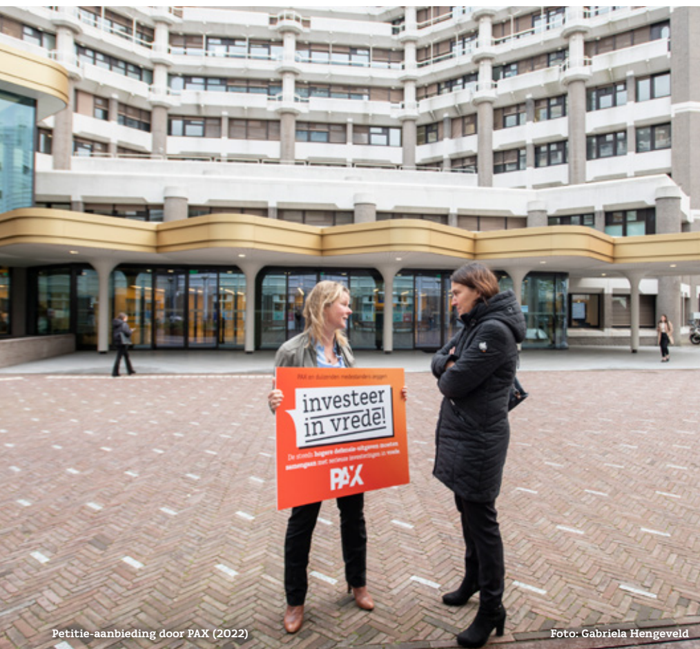
Petitie-aanbieding door PAX (2022)