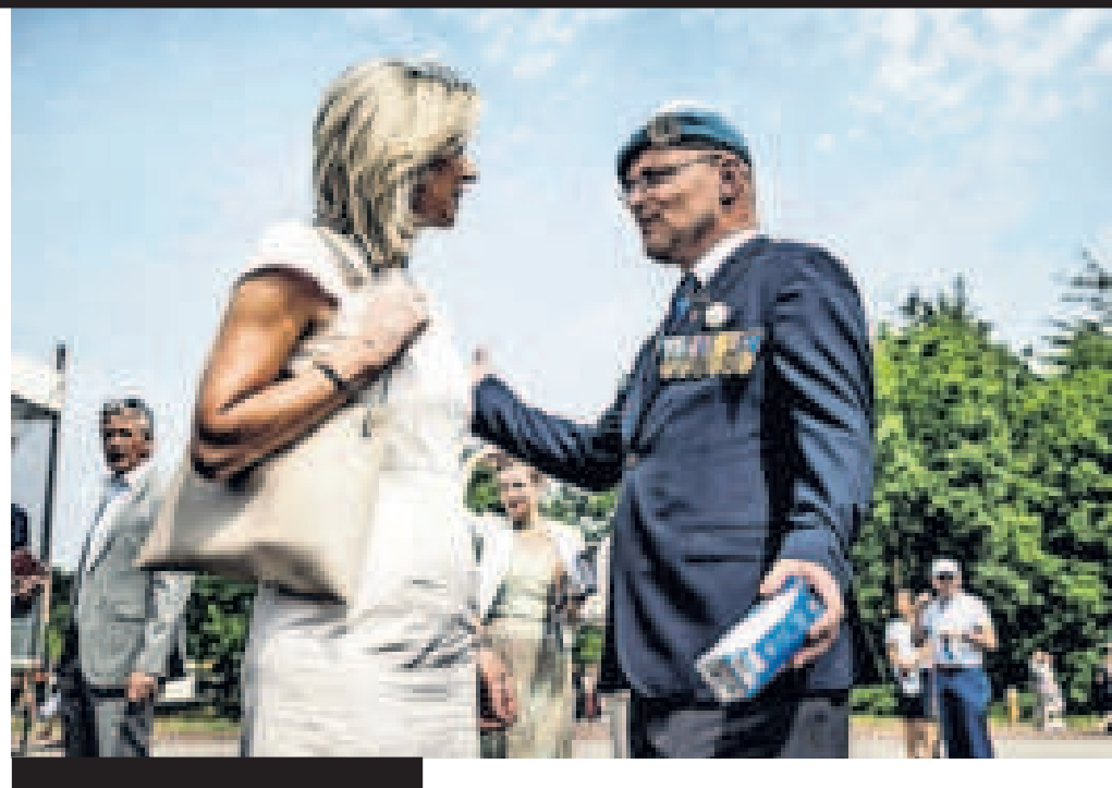
→ Minister Kajsa Ollongren van Defensie (I) praat met een veteraan van Dutchbat-III in de Oranjekazerne in Schaarsbergen.

In dit geval gaven premier Rutte en minister van Defensie Ollongren aan dat de overheid dingen beter anders had kunnen doen. "Sommige woorden zijn na 27 jaar nog steeds niet uitgesproken," zei Rutte. "Het is waar dat de Srebrenica-missie plaatsvond onder een VN-mandaat, maar dat doet niets af aan de speciale verantwoordelijkheid van de Nederlandse staat voor de omstandigheden waaronder jullie werden uitgezonden, voor de opvang na terugkeer en voor het gebrek aan steun toen Dutchbat III in de beeldvorming onterecht in het beklagdenbankje terecht kwam. Vandaag maak ik namens de Nederlandse regering excuses aan alle vrou-